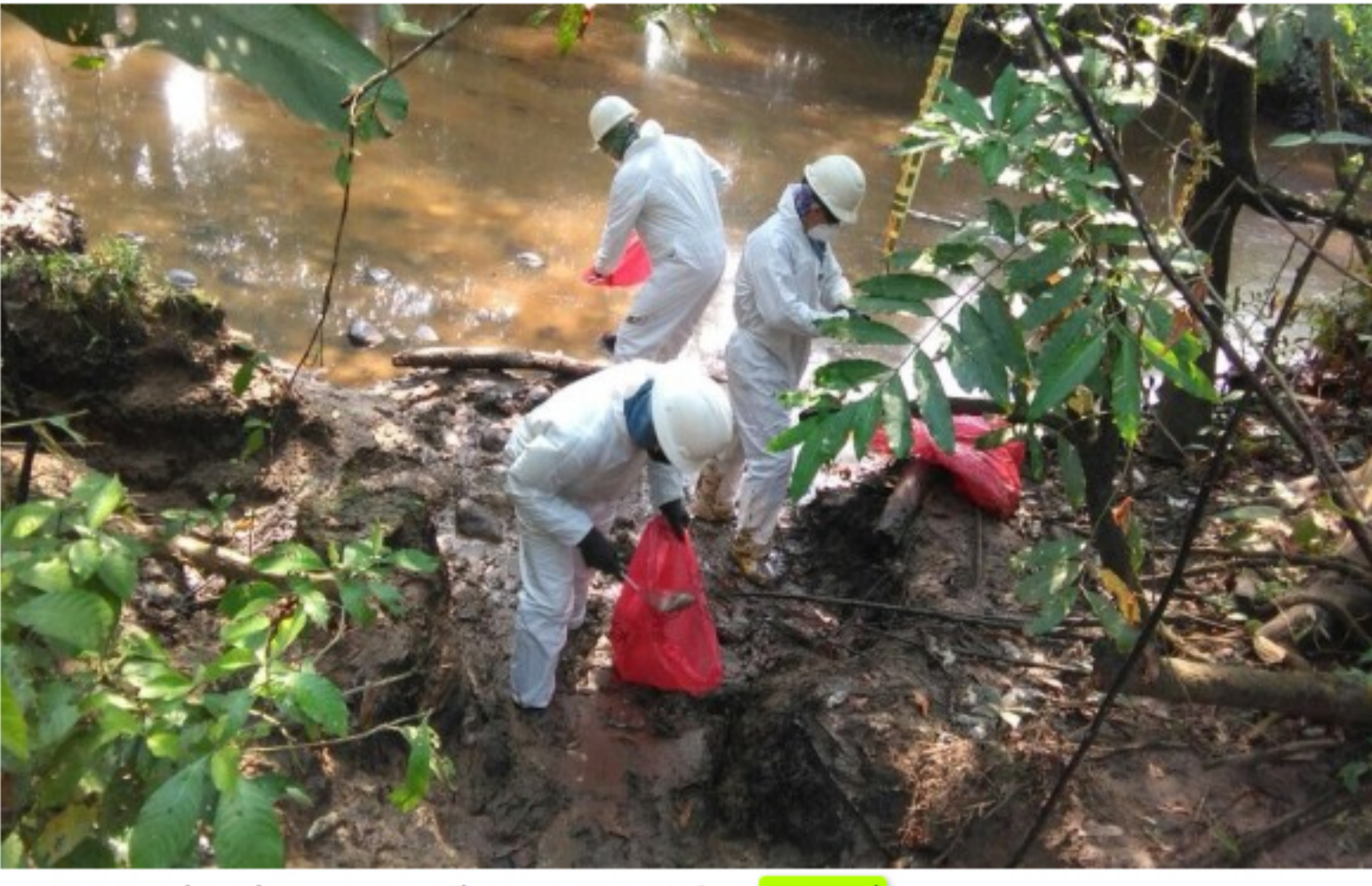
Imagen de archivo del derrame en La Lizama.

COLOMBIA CONTAMINACIÓN AMBIENTAL ECOPETROL MEDIO AMBIENTE