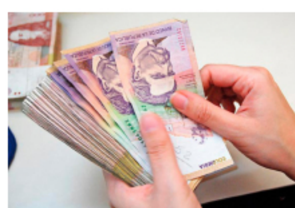
Colombia: Plataforma Tpga lanza nuevo servicio para retiro de dinero