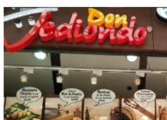
Colombia: Tras difícil situación financiera, restaurantes Don Jediondo iniciará proceso de reorganización