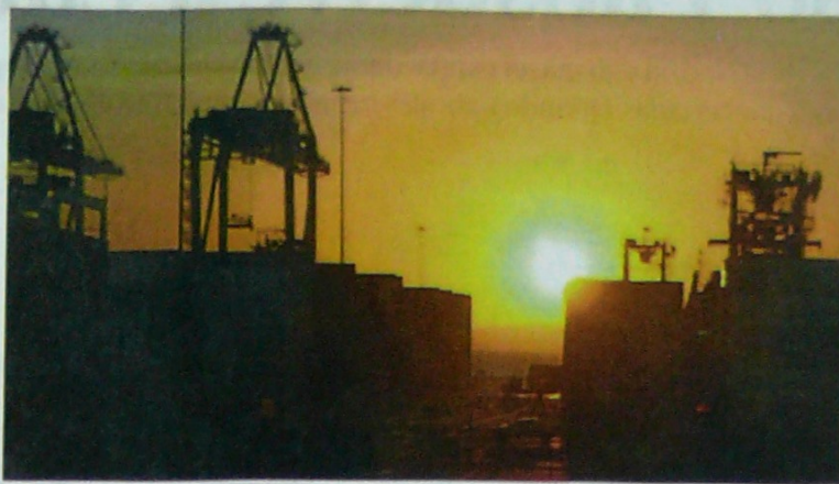
Instalaciones portuarias de Contecar.

vieron una variación de -4,9% entre enero y noviembre de 2019, el departamento sigue siendo el líder en compras en el exterior en la Costa Caribe, con una participación de 5,4%. El DANE señaló que en ese periodo las importaciones de Bolívar fueron de 2.606,8 millones de dólares, frente a los 2.740,6 millones de dólares de 2018.