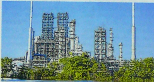
Refinería de Cartagena, en Mamonal.

McDermott International Inc. se acogió al Capítulo 11 de la legislación estadounidense, que permite un procedimiento de reorganización empresarial, mediante el cual el deudor reestructura su deuda. Con ello lo que busca el deudor es llegar a un acuerdo con sus acreedores con el fin de fortalecer financieramente a la compañía, seguir operando y pagar sus compromisos. Frente a esos ese anuncio