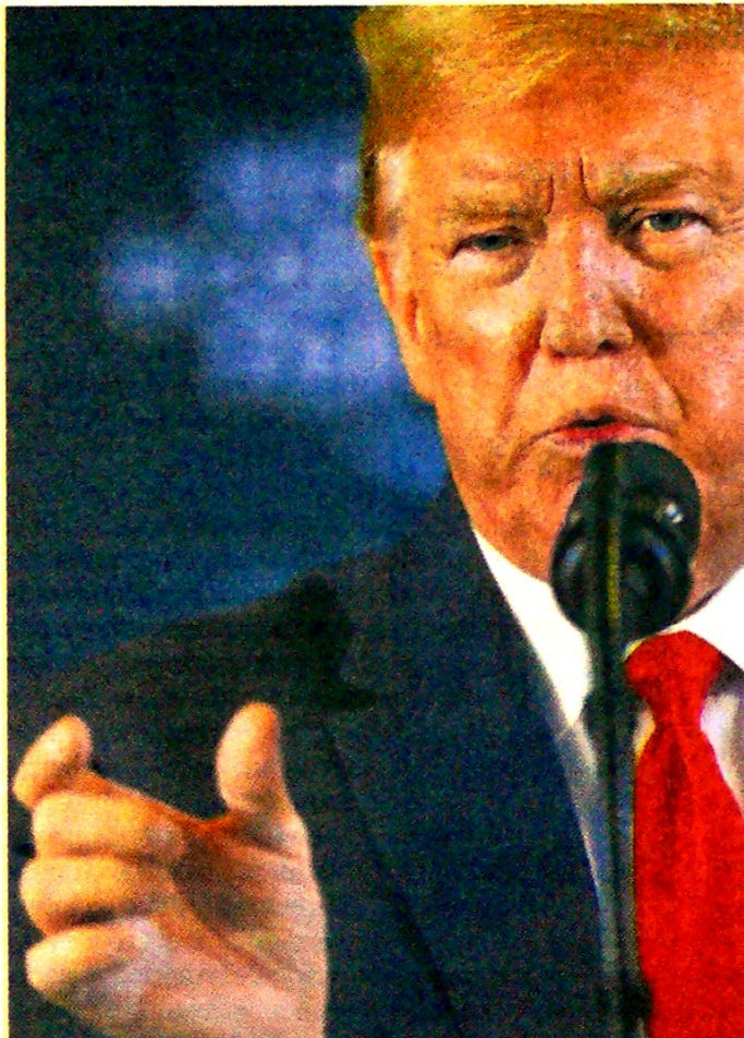
Donald Trump participó en el Foro de Davos.

Preguntado en una rueda de prensa sobre si es posible un acuerdo antes de las