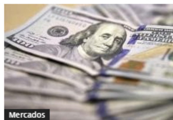
Dólar en Colombia sube a precio más alto desde mediados de diciembre; Bolsa cayó