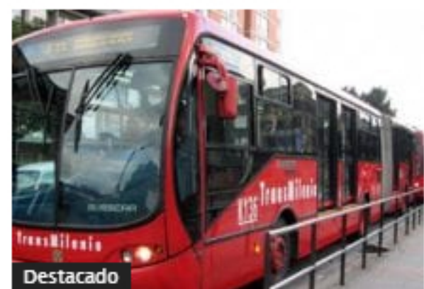
Alcaldía de Bogotá adjudicó Transmilenio por la Avenida 68