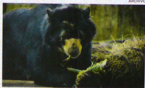
El oso 'Chucho' interactúa con su compañera en el Zoológico de Barranquilla.

En el proyecto de fallo se ordenaría la conformación de un comité que busque en tres meses un lugar para Chucho, donde sea "libre" pero donde también