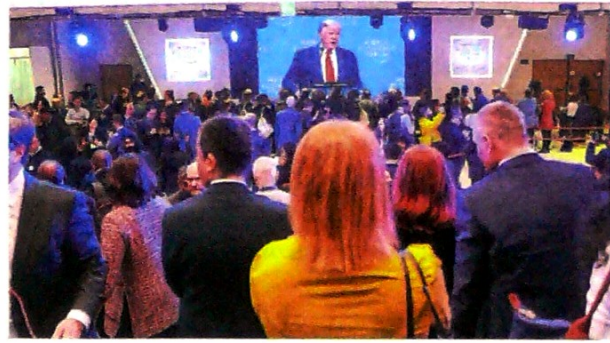
Asistentes al Foro de Davos atienden la intervención del presidente de EE. UU., Donald Trump.

te estadounidense, en su intervención en el foro, reclamó como victorias las negociaciones con México y China. Dijo: "Soportamos el desastre que significó el TLCAN (Tratado de Libre Comercio de Norteamérica), que fue el peor que se firmó en los últimos 25 años". Así mismo, Trump comentó: "China perjudicó nuestro comercio, pero nadie pensó en hacer algo al respecto, hasta que nosotros decidimos enfrentar el problema. Entonces China aceptó hacer cosas como proteger la propiedad intelectual, abrir su sector financiero y mantener su moneda estable".