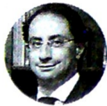
José Manuel Restrepo Ministro de Comercio, Industria y Turismo

COMERCIO. EL PRESIDENTE IVÁN DUQUE Y SU COMITIVA PARTICIPARÁN EN EL FORO ECONÓMICO MUNDIAL. ALLÍ, HABRÁ ENCUENTROS CON MÁS DE 20 INVERSIONISTAS A QUIENES SE LES MOSTRARÁ LOS NEGOCIOS DEL PAÍS