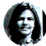
Flavia Santoro Presidente de ProColombia

"Estar en Davos también significa el reconocimiento de que Colombia es hoy protagonista en América Latina en temas como el emprendimiento y la Cuarta Revolución Industrial".