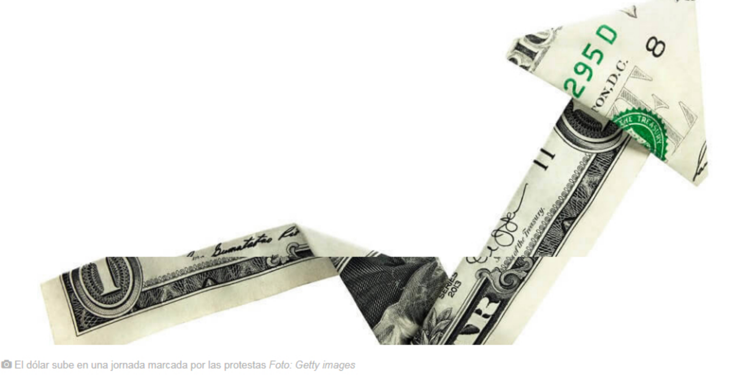
El dólar sube en una jornada marcada por las protestas

Una jornada negativa para la cotización del peso colombiano que cerró alrededor de los $3.354. El aumento de la aversión al riesgo a nivel internacional y las protestas a nivel local habrían influido en la fuerte alza del dólar de hoy.