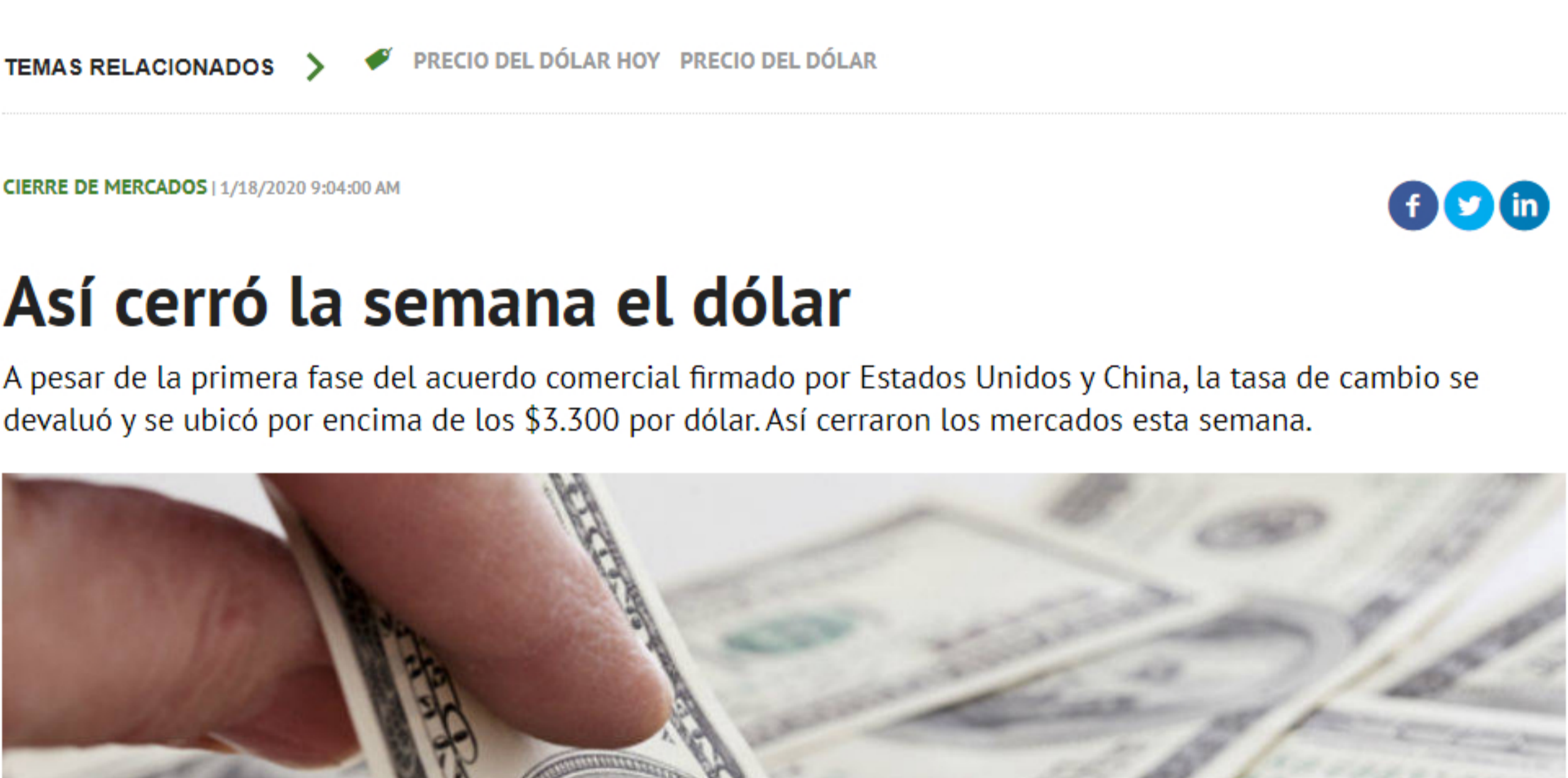
Así cerró la semana el dólar

A pesar de la primera fase del acuerdo comercial firmado por Estados Unidos y China, la tasa de cambio se devaluó y se ubicó por encima de los $3.300 por dólar. Así cerraron los mercados esta semana.