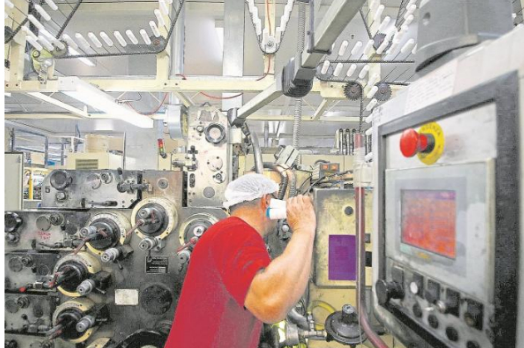
Las cifras son los primeros datos que muestran el impacto económico de las protestas antigubernamentales que comenzaron el 21 de noviembre.

POR: PORTAFOLIO - ENERO 17 DE 2020 - 01:22 P.M.