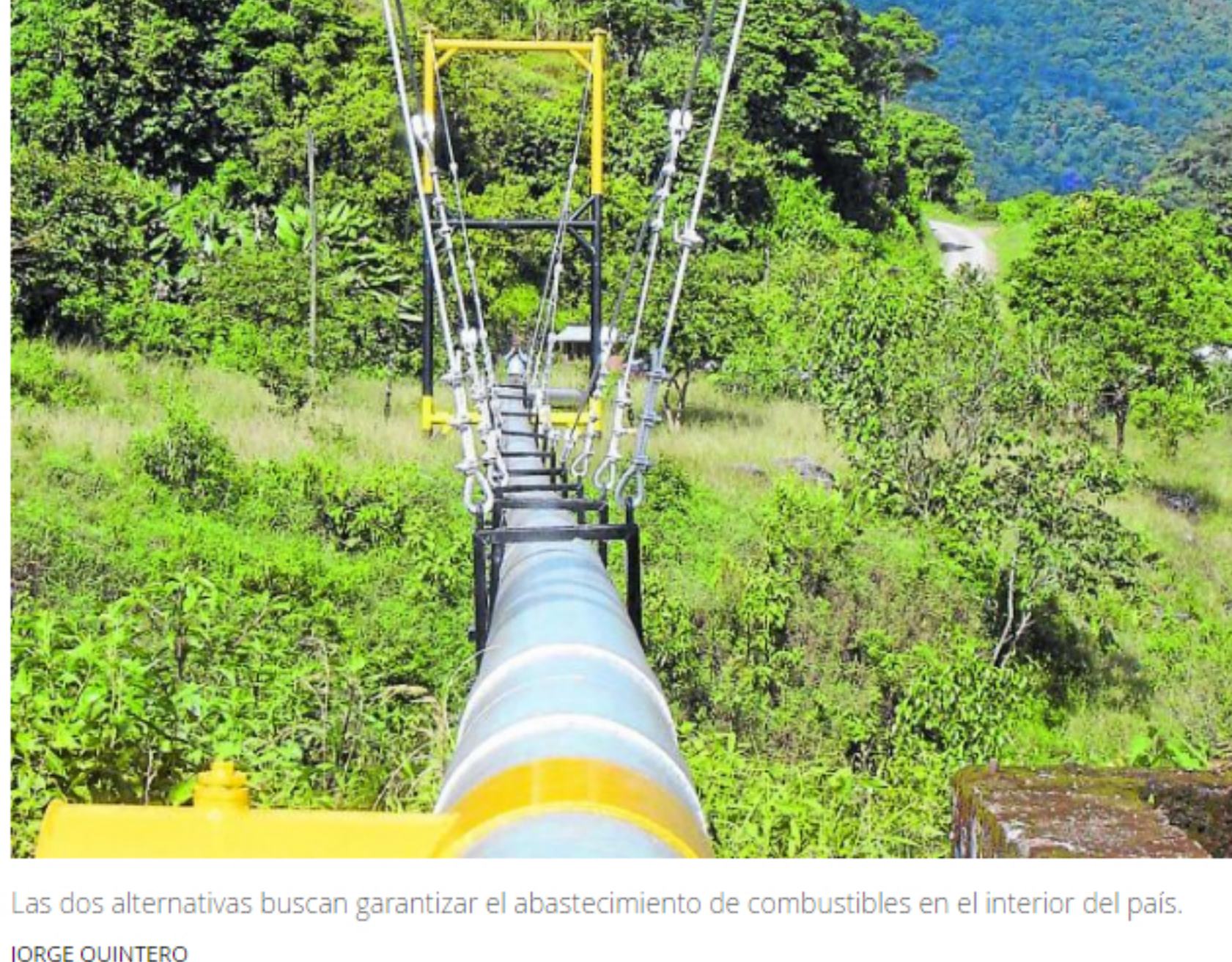
Las dos alternativas buscan garantizar el abastecimiento de combustibles en el interior del país. JORGE QUINTERO

POR: PORTAFOLIO - ENERO 16 DE 2020 - 10:04 P.M.