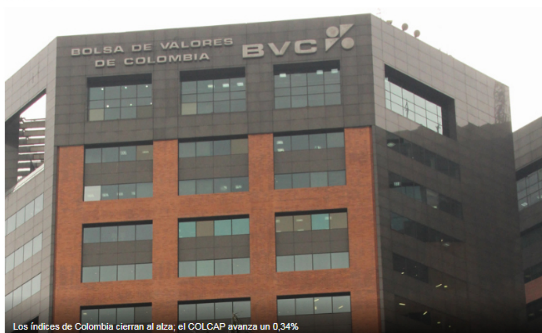
Los índices de Colombia cierran al alza; el COLCAP avanza un 0,34%

Investing.com – La Bolsa de Colombia cerró con avances este viernes; las ganancias de los sectores agricultura , COL Inversionist , y servicios públicos impulsaron a los índices al alza.