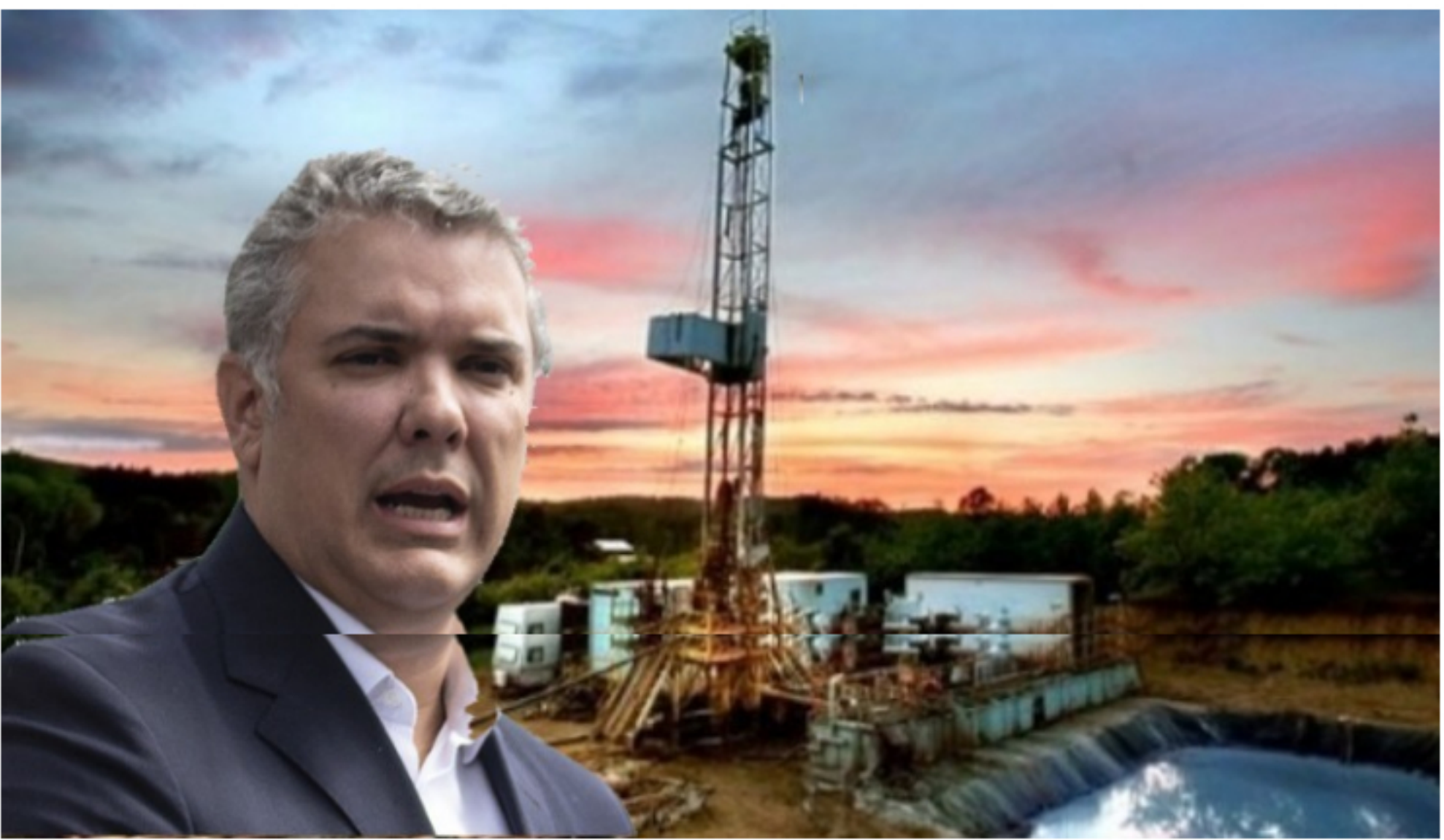
El gobierno pasa por encima de los diversos estudios que dan cuenta del daño ambiental que el 'fracking' genera en los ecosistemas.

Este es un espacio de expresión libre e independiente que refleja exclusivamente los puntos de vista de los autores y no compromete el pensamiento ni la opinión de Las2Orillas.