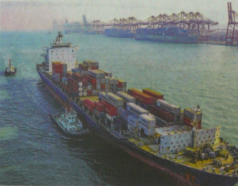
Un barco con contenedores llega al puerto de Qingdao en China.

"A pesar de este acuerdo, aún habrá una tasa arancelaria general para un grupo de artículos importados de China del 21%, los cuales tenían una tasa cercana al 3% antes de comenzar la guerra comercial", dijo Lacoutre. A dos días de la firma,