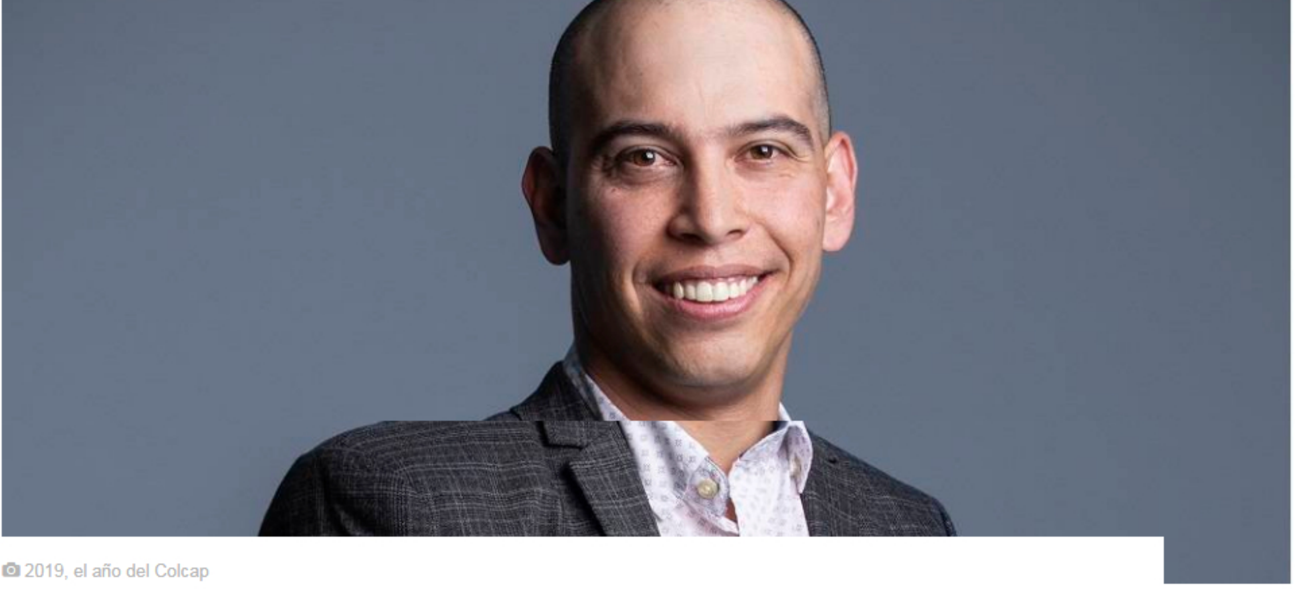
© 2019, el año del Colcap

En medio de un complejo contexto internacional, el año pasado fue bueno para el mercado accionario local medido por el comportamiento del índice Colcap, por eso quiero dedicar mi columna de esta semana a hablar al respecto.