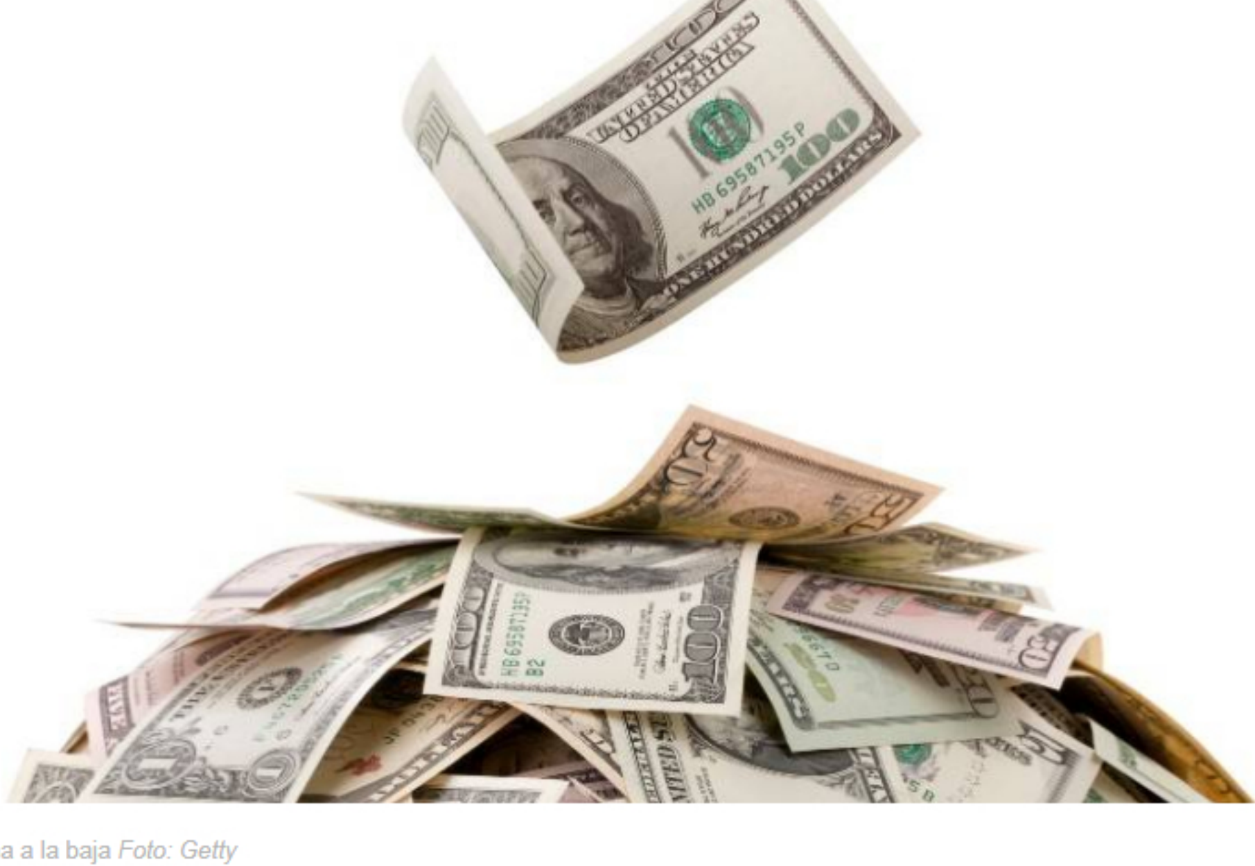
Dólar arranca la semana a la baja

El dólar cayó este lunes 1,44% frente al cierre de marzo, lo cual deja la cotización en $3.142,15. Buenos datos en China y la expectativa de que la demanda de petróleo no se debilite son algunas de las razones.