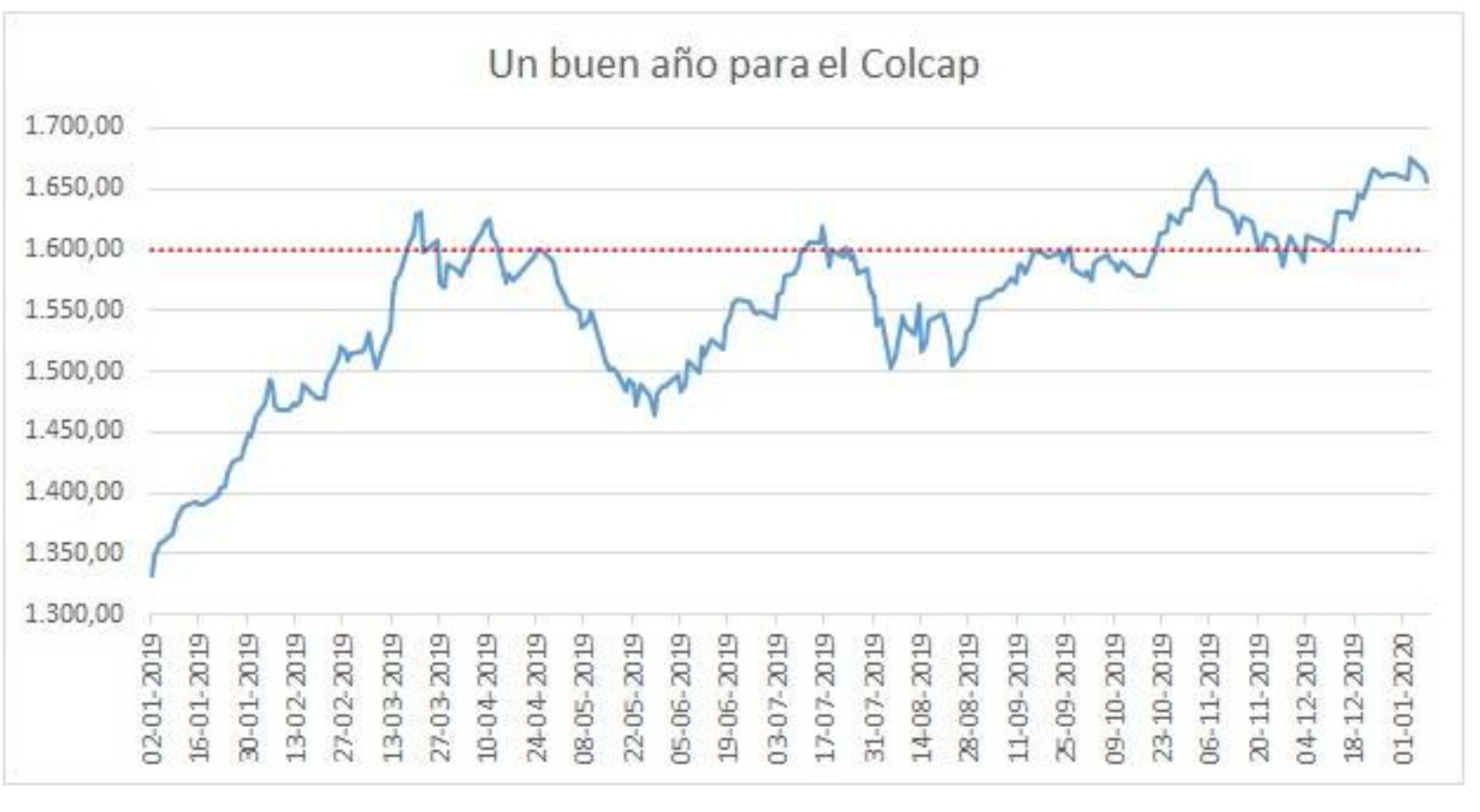
Gráfico 1. Elaboración propia. Datos Banco de la República.

Creo que lo más interesante durante el año anterior es ver cómo después de agosto se estabiliza el índice en una zona muy sólida por encima de los 1.600, llegando a cerrar el año en 1.662, lo que equivale a una rentabilidad de 24,73 %, mostrando una muy buena dinámica, en especial si tenemos en cuenta que estamos hablando de un mercado emergente en un año marcado por la aversión al riesgo de los inversionistas.