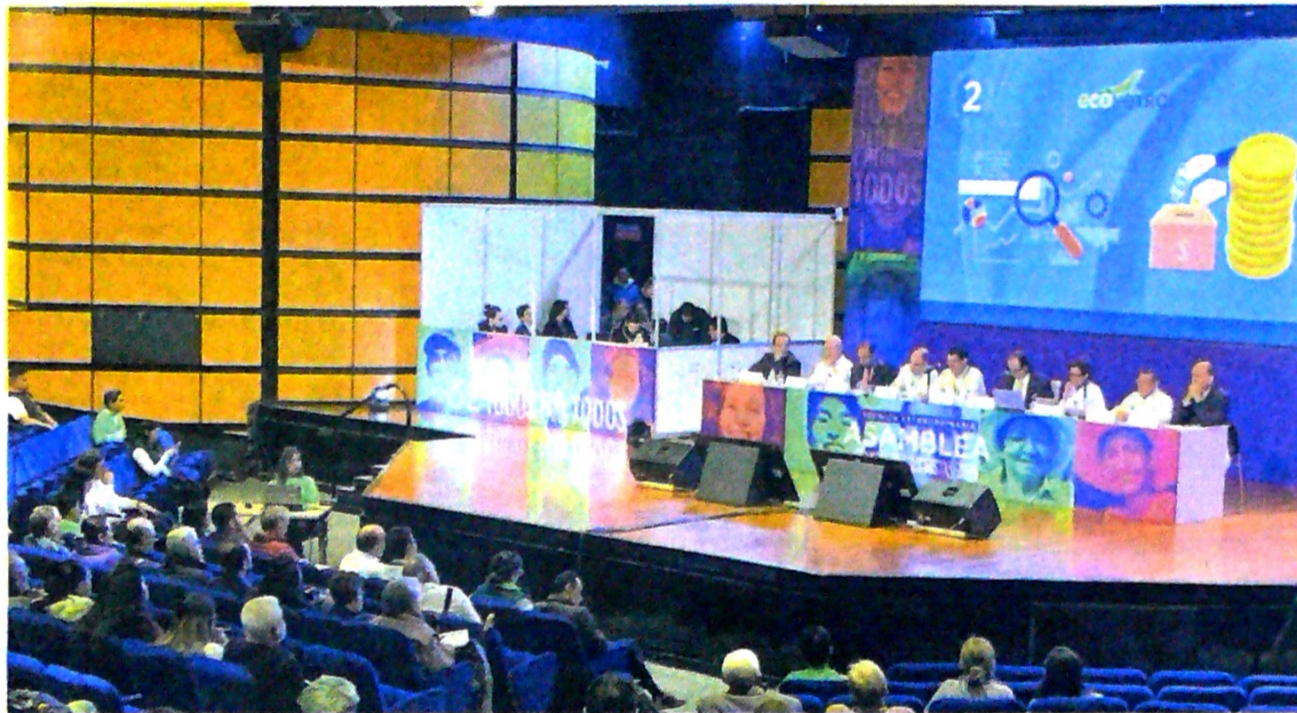
En total, Ecopetrol le dejó al Gobierno Nacional más de $11 billones el año pasado por los dividendos ordinario y extra. Ecopetrol

El más reciente quedó plasmado en el Decreto