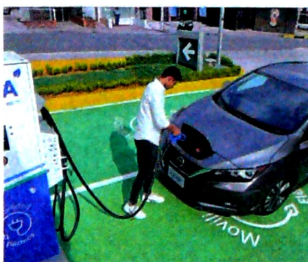
Por vehículos eléctricos y más consumo de gas, en 2050 el país reducirá el uso de diésel y gasolina en un 20 %.

“Uno quisiera que la tecnología ya esté lista para cambiarnos a algo con cero emisiones. La realidad es que hoy todavía no se puede generar una sustitución