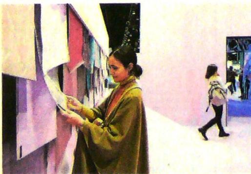
La Feria de Frankfurt es una de las más tradicionales y grandes del mundo, con más de 50 años.

La feria está programada para los días 27, 28 y 29 de abril de 2021 en el recinto Plaza Mayor, de Medellín.