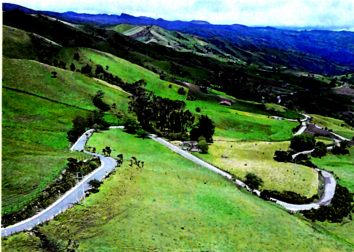
La localidad de Sumapaz tiene 380 km de malla vial, de los cuales 120 km son de la troncal Bolivariana (foto), una vía que la conecta con Usme. El resto son carreteras rurales que están en mal estado.

Una cámara de seguridad en el barrio Bosa Porvenir, en el suroccidente de la ciudad, captó el momento preciso en el que dos delincuentes abordan a un joven motociclista y lo despojan de su vehículo. Los hombres habrían utilizado un arma de fuego para intimidar a la víctima y luego huir del lugar en la moto.