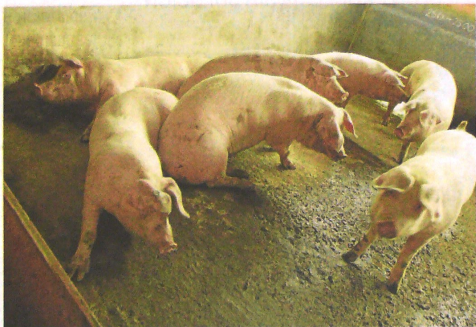
La producción estimada de carne de cerdo en Colombia, alcanzó una cifra récord en octubre de 2019, consolidando 367.408 t, la cifra más alta en los últimos años.

El los primeros 11 meses del año pasado, el beneficio formal de porcinos en el departamento registró un crecimiento del 25,2%.