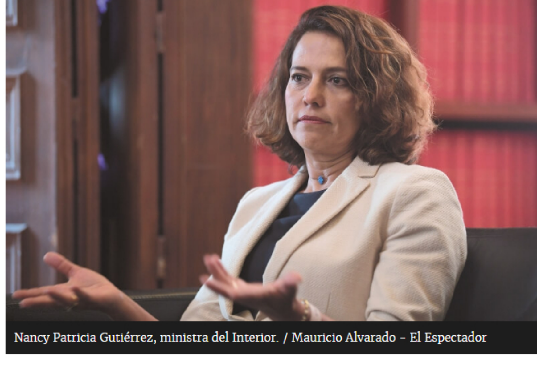
Nancy Patricia Gutiérrez, ministra del Interior.