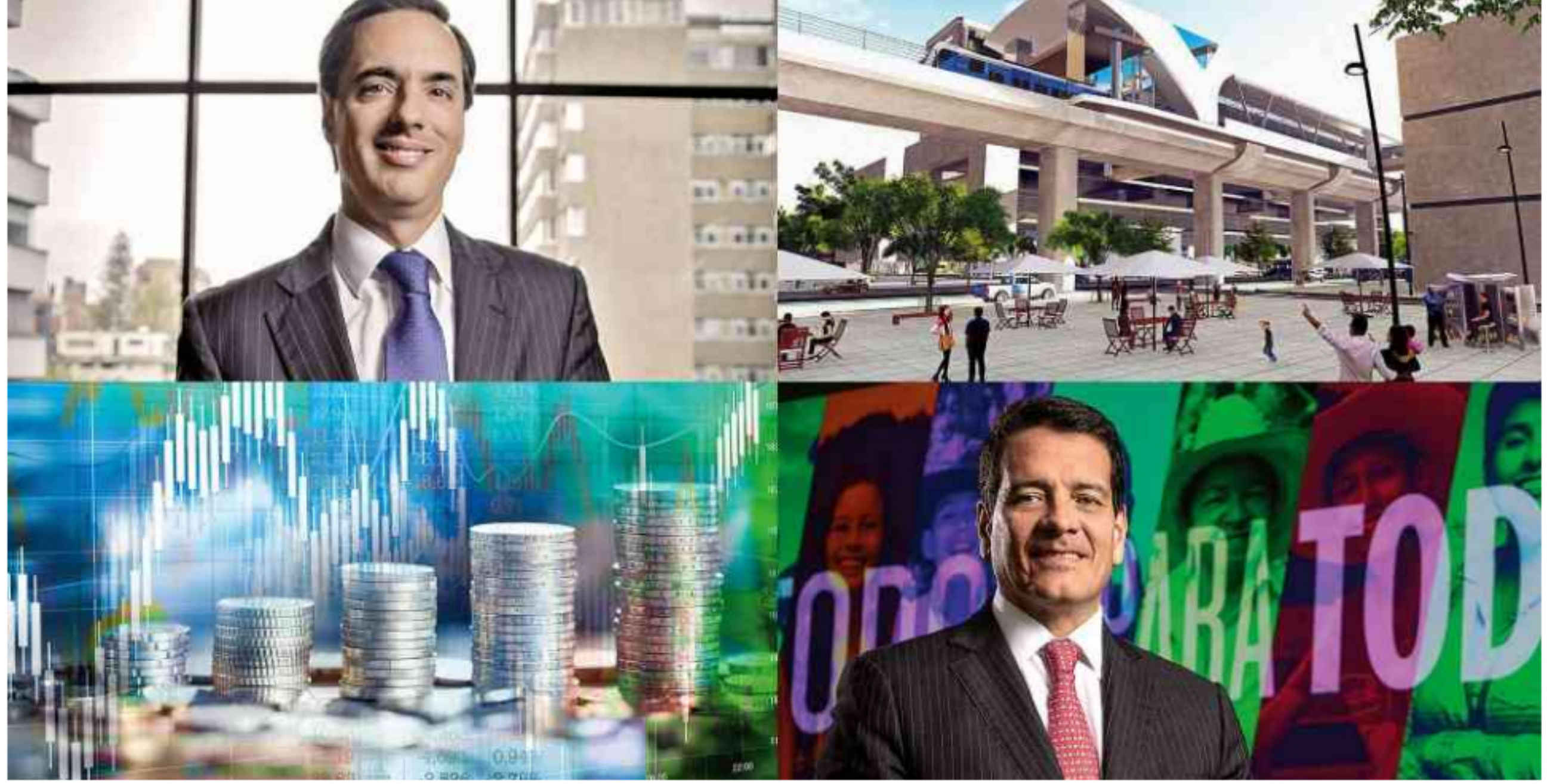
Siete noticias económicas de la semana

Firma del contrato del Metro de Bogotá, los nuevos objetivos de Telefónica y los planes 2020 de Ecopetrol son algunos de los hechos que marcaron la agenda económica de la semana.