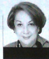
En Parroquia BEATRIZ LÓPEZ

ciencia y la responsabilidad hubieran primado sobre la cultura siniestra de celebrar en Navidad, Año Nuevo y en general en las fiestas decembrinas, con fuegos artificiales. O si se hubieran atendido las prohibiciones que rigieron en todo el departamento durante esta época. La pregunta ahora es qué más se va a hacer cuando es obvio que las medidas restrictivas no son suficientes para detener ese flagelo que se convierte en tragedia para decenas de familias durante el fin de año. Mientras no se eduque a la población, en especial a las nuevas generaciones para que comprendan los peligros de utilizar la pólvora, y se genere el cambio en la mentalidad y en las costumbres de los colombianos, cada principio de enero el país y el Valle seguirán lamentando a sus víctimas.