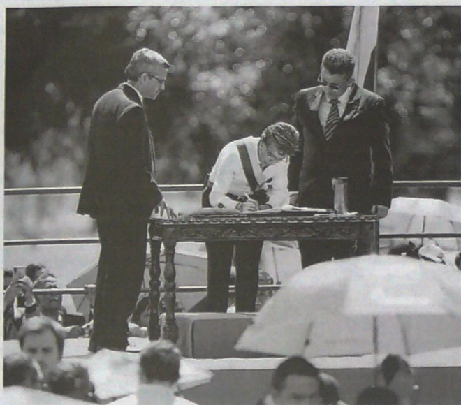
Colprensa - EL NUEVO DÍA

La Ley 2013 que entró en vigencia dispone que los nuevos mandatarios deberán publicar declaración de bienes y rentas, registro de conflictos de interés y declaración del impuesto sobre la renta.