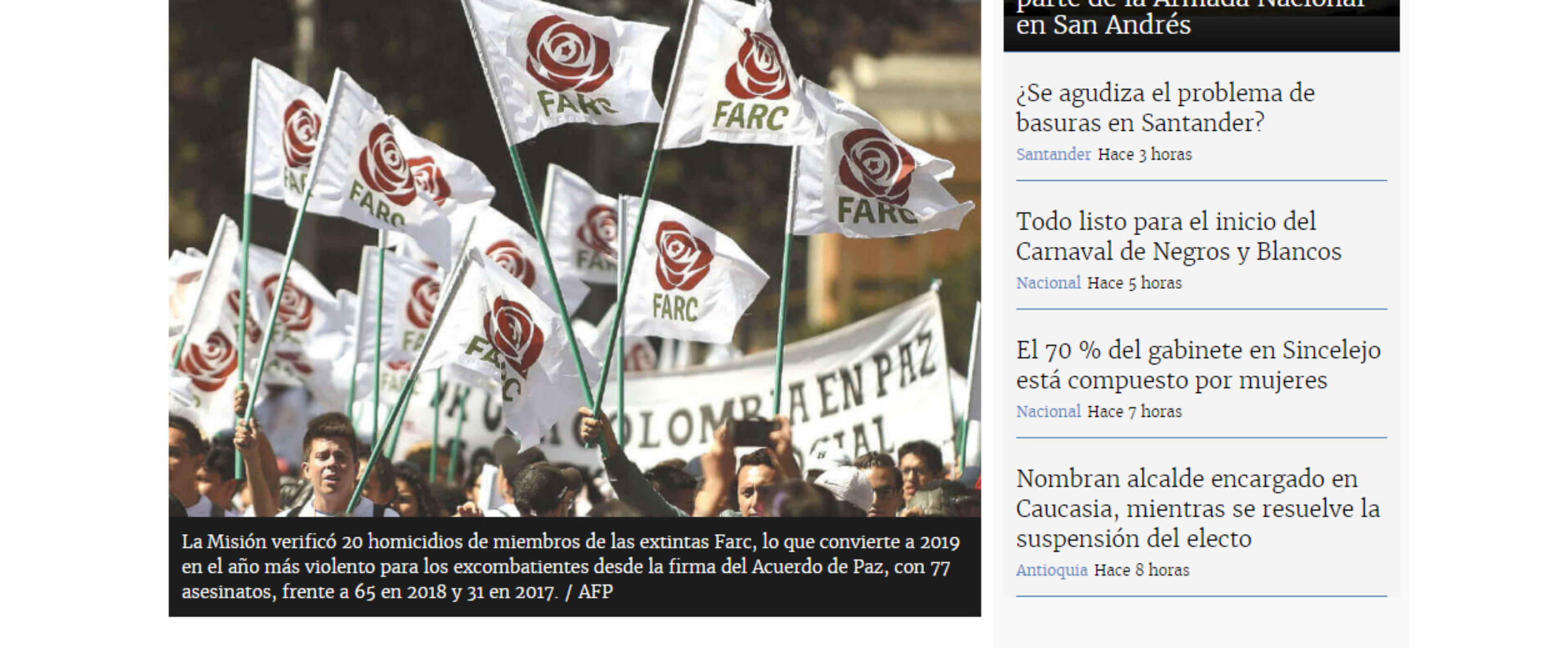
La Misión verificó 20 homicidios de miembros de las extintas Farc, lo que convierte a 2019 en el año más violento para los excombatientes desde la firma del Acuerdo de Paz, con 77 asesinatos, frente a 65 en 2018 y 31 en 2017.