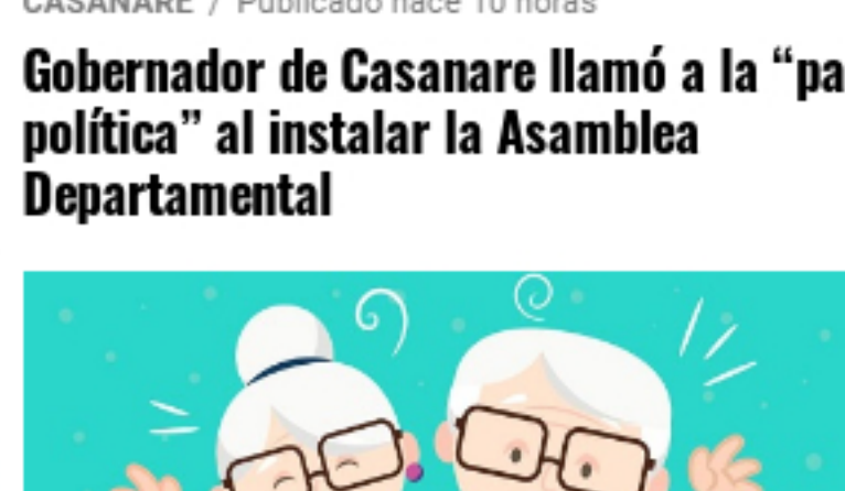
Subsidio para los abuelos colombianos sube a 80 mil pesos