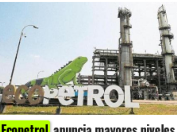
Ecopetrol anuncia mayores niveles de inversión para 2020