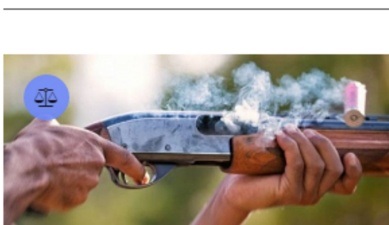
Niña resultó herida con arma de fuego por su propio padre en zona rural de Pore