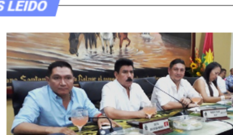
Gobernador de Casanare llamó a la "paz política" al instalar la Asamblea Departamental