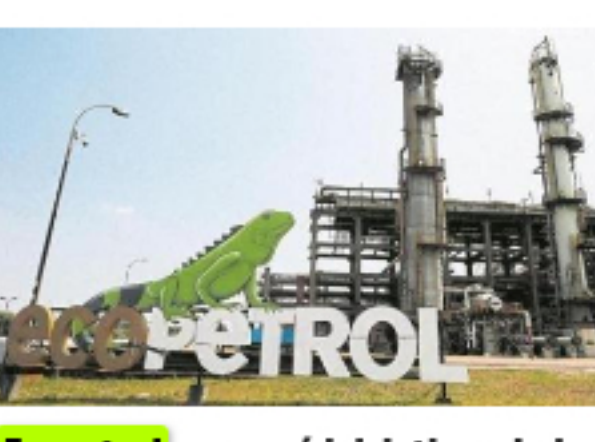
Ecopetrol apoyará iniciativas de la Misión de Sabios 2019