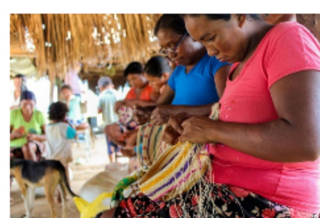
Mujeres Sikuani participan por primera vez en Expoartesánias