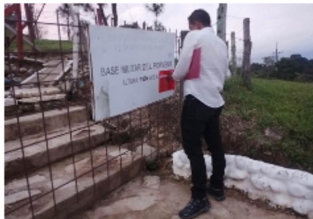
Por pésimas condiciones de higiene cierran base militar de El Porvenir en Manabao