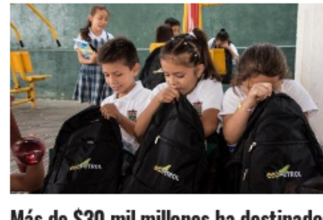
Más de $30 mil millones ha destinado Ecopetrol para la inversión social en Casanare