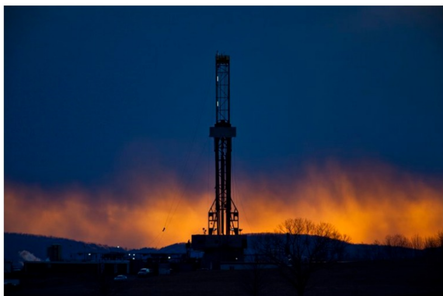
En la imagen, una plataforma de perforación de fractura hidráulica.

Como si fuera un anticipo navideño, el pasado 24 de diciembre, Ecopetrol y la Agencia Nacional de Hidrocarburos (ANH) dieron luz verde al primer contrato para iniciar un piloto de fracking en Colombia : estará ubicado en el valle Medio del Magdalena y lleva por nombre Kale .