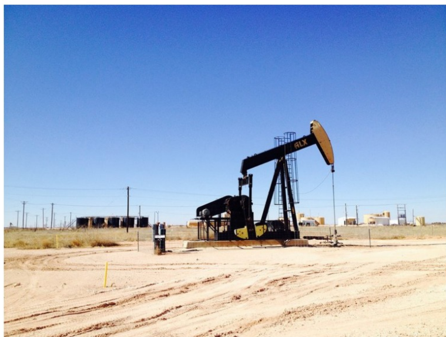
Colombia iniciará 2021 con 4 proyectos de Fracking en el Medio Magdalena y Guajira.

A la espera de este tipo de resultados, así como de evaluaciones prospectivas relacionadas con el impacto al medio ambiente, se pronunciaría el Consejo de Estado para autorizar este tipo de extracciones no convencionales en Colombia.