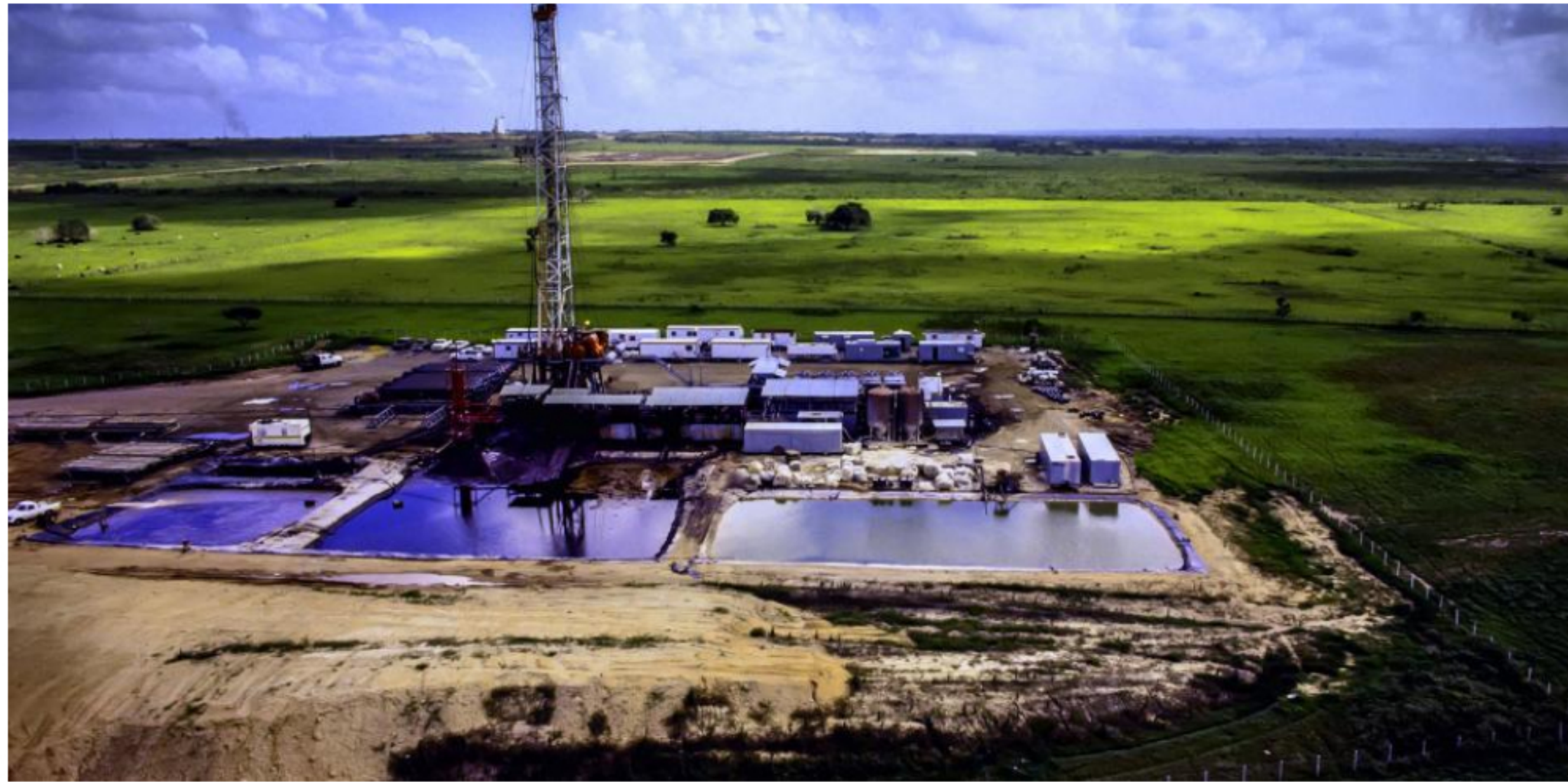
Los proyectos piloto buscan ahondar el conocimiento para definir si la explotación comercial con el fracking es viable, y puedan elevar la autosuficiencia en gas y en petróleo.

RELACIONADOS: PETRÓLEO EN COLOMBIA | ECOPETROL | GAS NATURAL | AGENCIA NACIONAL DE HIDROCARBUROS | FRACKING