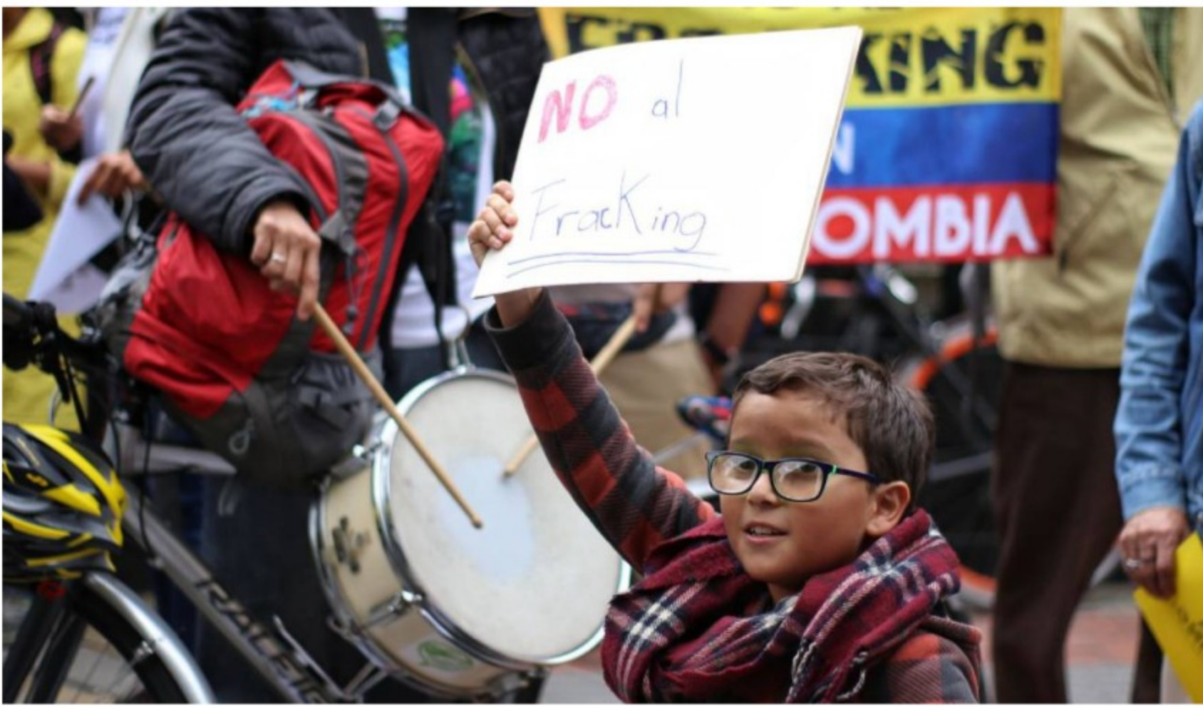
Fracking en Colombia.

Ambientalistas advierten que la técnica de fracturamiento hidráulico se aplicará en 455 hectáreas de una cuenca del Río Magdalena, en Puerto Wilches.