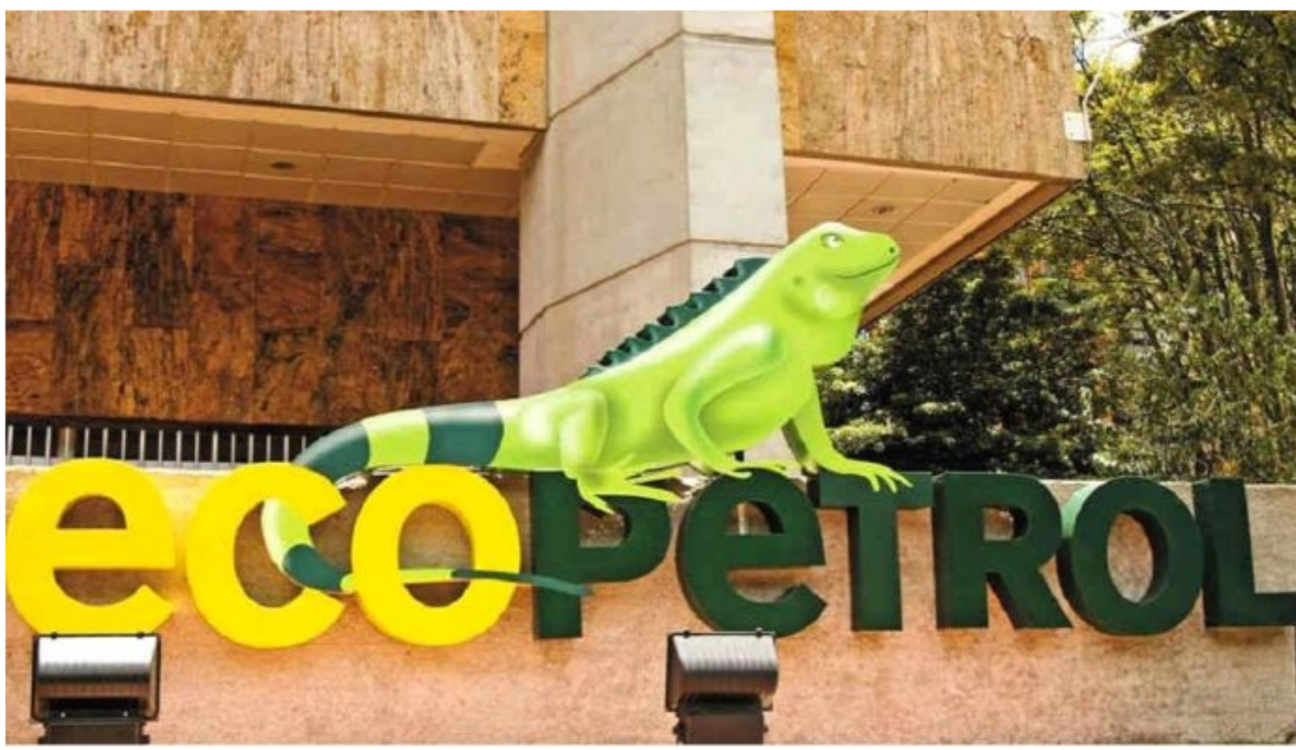
Ecopetrol | invertirá en transición energética.

El Ministerio de Ciencias de la República y la Compañía de Petróleo de Colombia, Ecopetrol , firmaron un convenio que permitirá impulsar el desarrollo de nuevas tecnologías orientadas a una transición energética en Colombia .