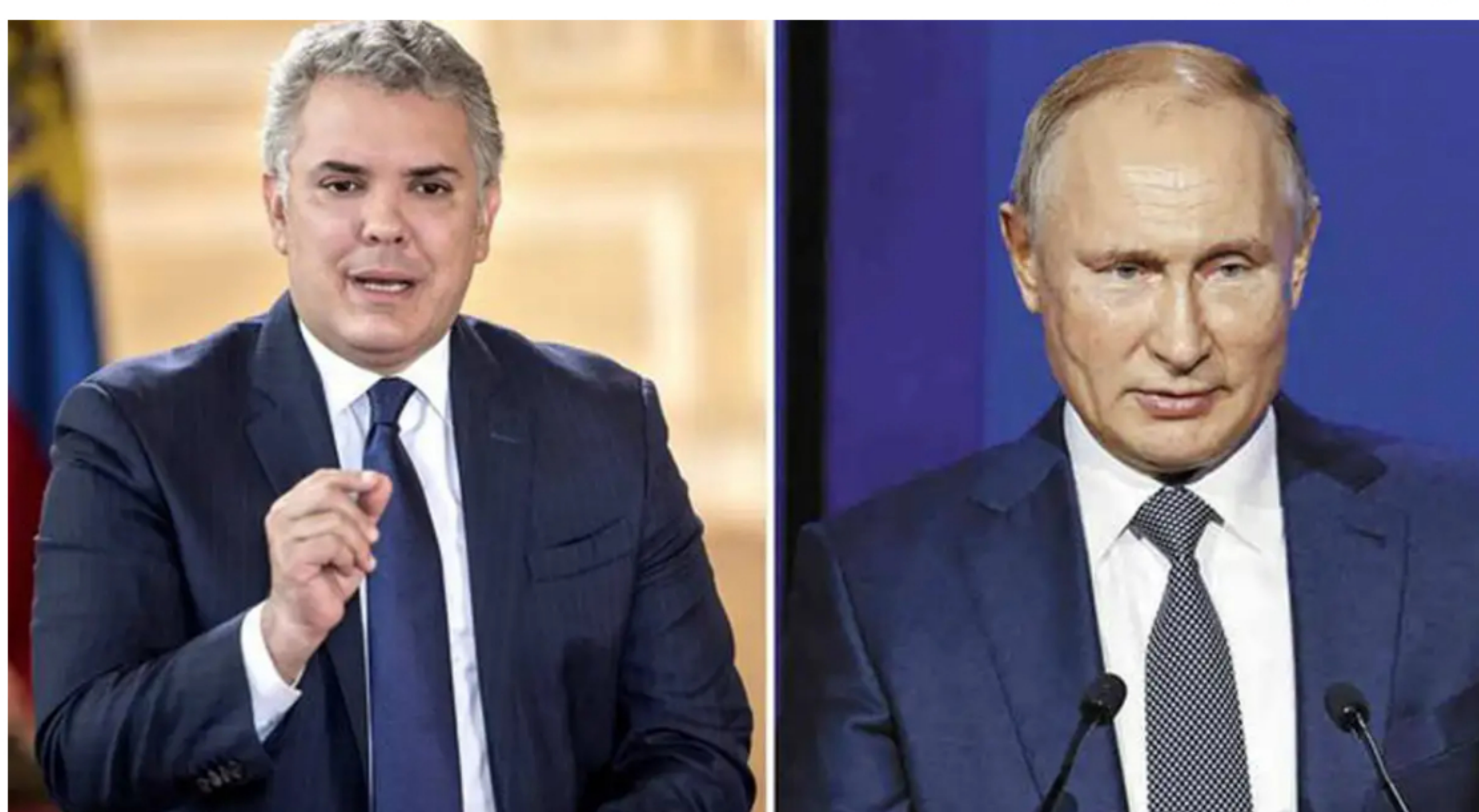
Mientras el presidente de Colombia acusa a Rusia de espionaje, el gobierno de Vladimir Putin lo niega.

En los últimos días la discusión generada por la expulsión de dos miembros del cuerpo diplomático de la Federación de Rusia en Colombia ha ido en aumento, en especial porque a partir de esta se ha iniciado un juego de palabras y afirmaciones del lado colombiano y por supuesto del lado ruso.