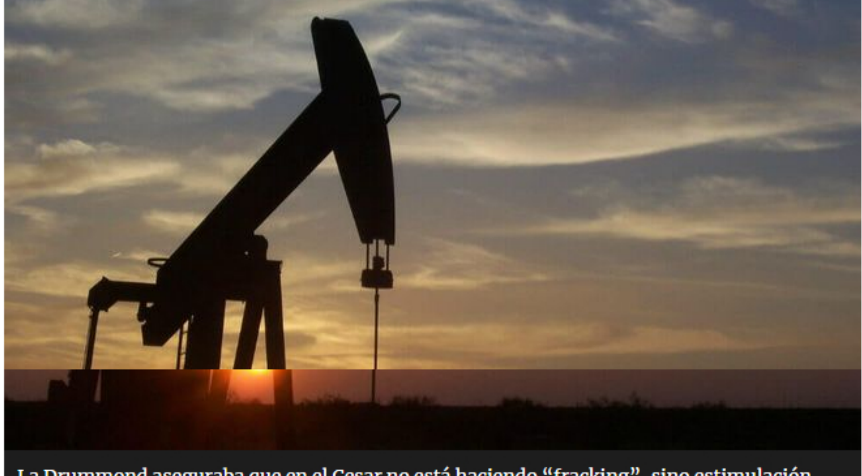
La Drummond aseguraba que en el Cesar no está haciendo "fracking", sino estimulación hidráulica convencional.