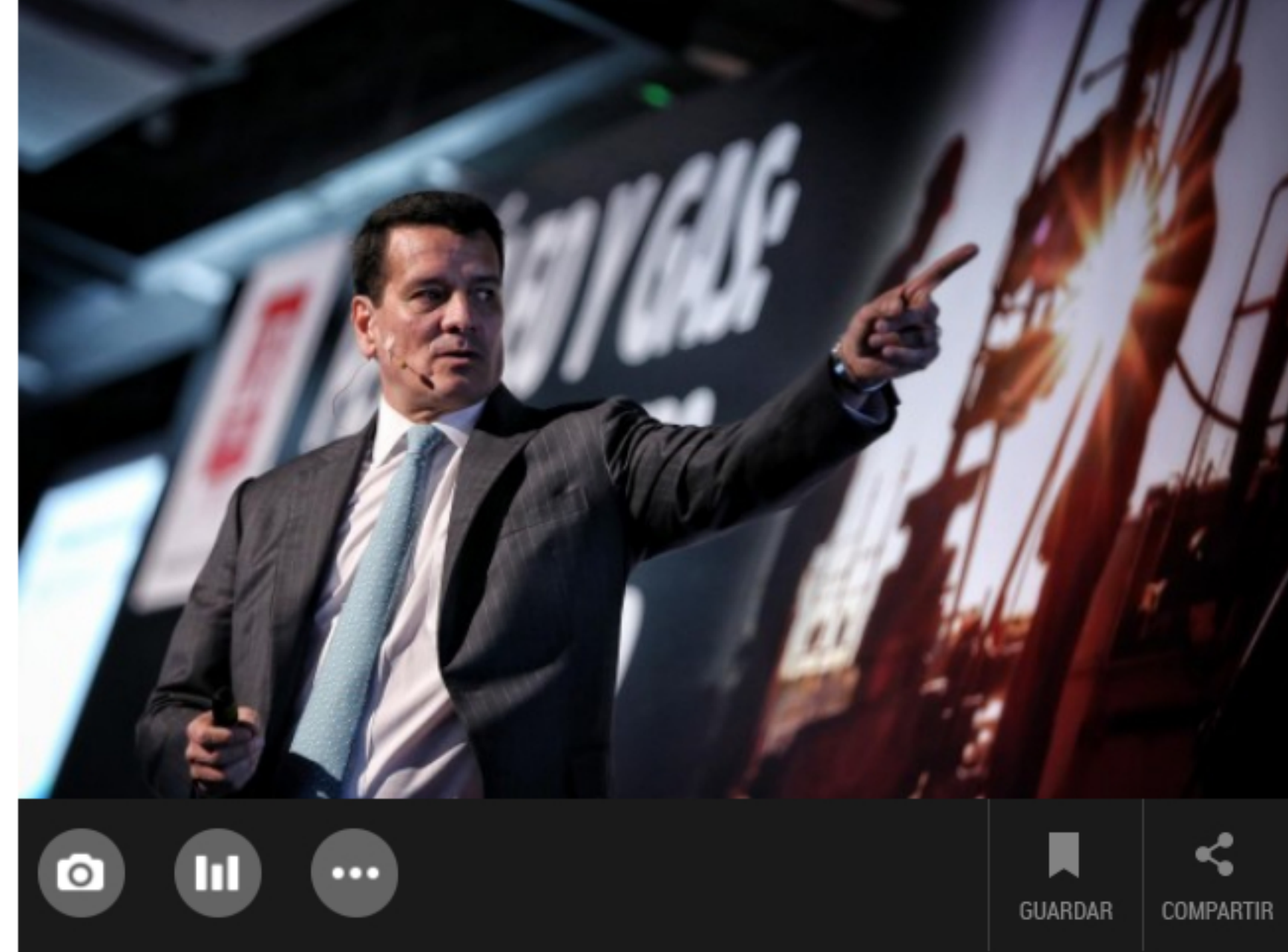
Felipe Bayón, presidente de Ecopetrol.