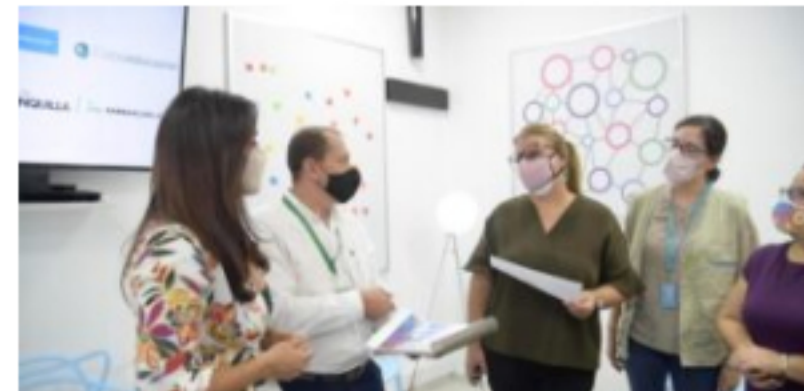
98 estudiantes del Distrito serán beneficiados con la llegada de un...