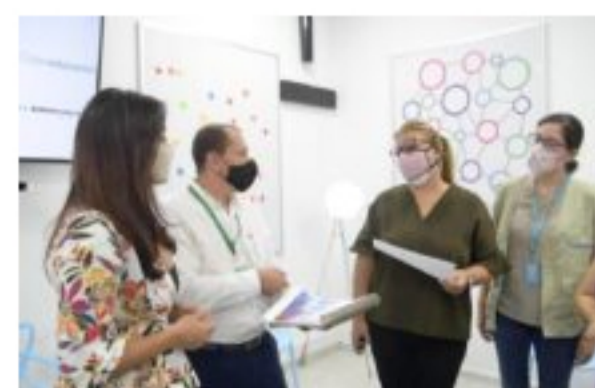
98 estudiantes del Distrito serán beneficiados con la llegada de un ecosistema de innovación