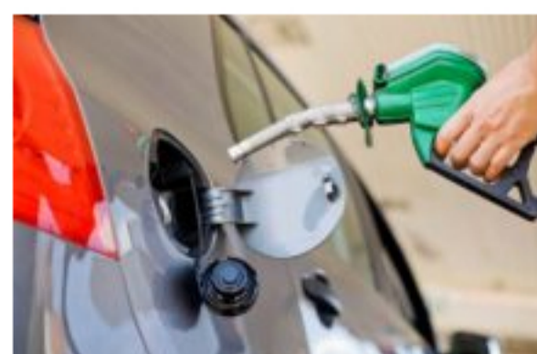
Precio del galón de gasolina aumenta desde este 16 de diciembre