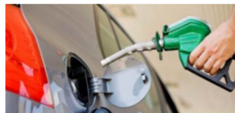
Precio del galón de gasolina aumenta desde este 16 de diciembre