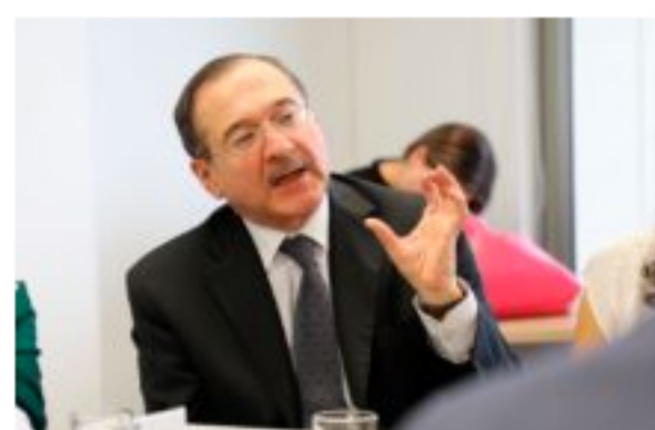
Eduardo Cifuentes: "El acuerdo de paz trasciende a los gobernantes de turno"