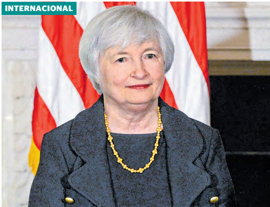
Janet Yellen será la Secretaria Económica del Gobierno de Joe Biden, desde el 20 de enero de 2021.