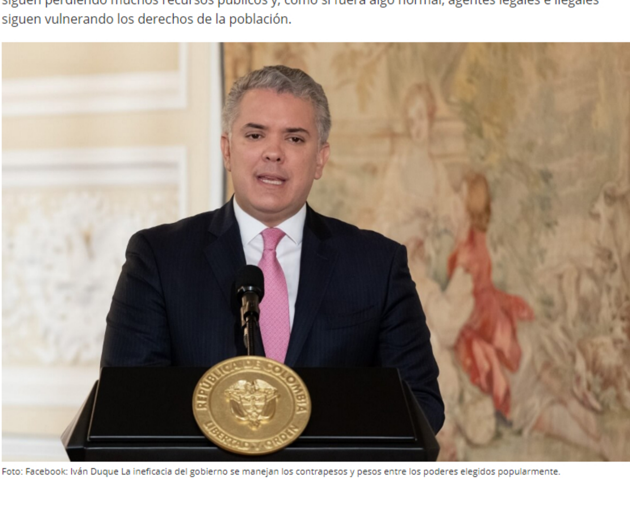
Foto: Facebook: Iván Duque La ineficacia del gobierno se manejan los contrapesos y pesos entre los poderes elegidos popularmente.

Los organismos de control presentan sus ejecutorias en cada rendición de cuentas. De todas formas, se siguen perdiendo muchos recursos públicos y, como si fuera algo normal, agentes legales e ilegales siguen vulnerando los derechos de la población.