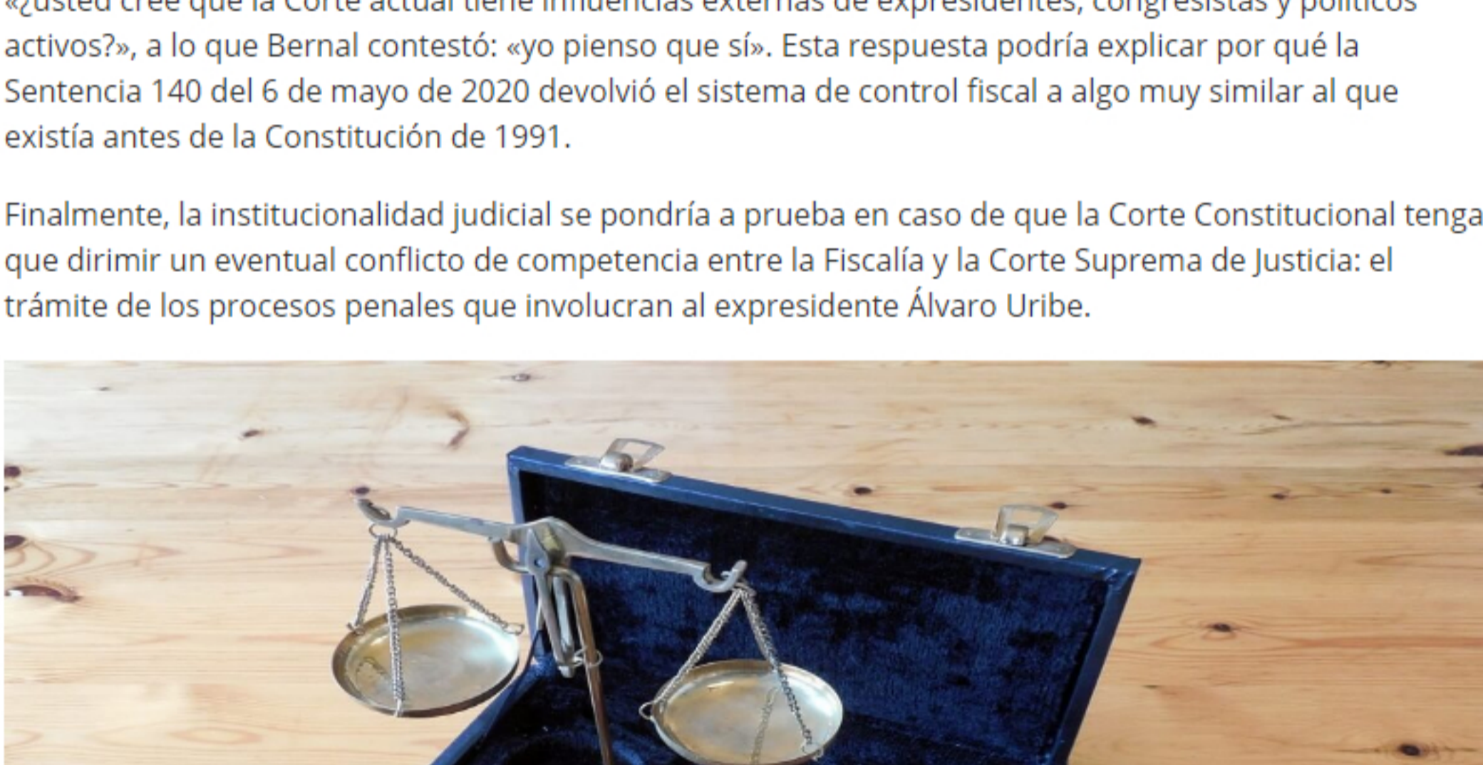
La constitución favorece la concentración de poderes.

Finalmente, la institucionalidad judicial se pondría a prueba en caso de que la Corte Constitucional tenga que dirimir un eventual conflicto de competencia entre la Fiscalía y la Corte Suprema de Justicia: el trámite de los procesos penales que involucran al expresidente Álvaro Uribe.