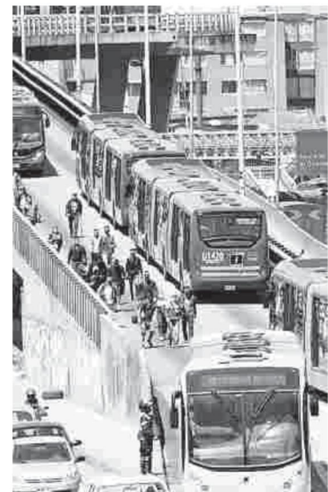
Ayer hubo caos en el tráfico de la ciudad por las protestas. El Tiempo

Debido a la creciente preocupación por el envejecimiento de la población colombiana, el Dane recomienda que en ese período de transición el país debe generar un mayor ahorro e inversión, aumentar la productividad y asignar más recursos a obras para recaudar más impuestos.