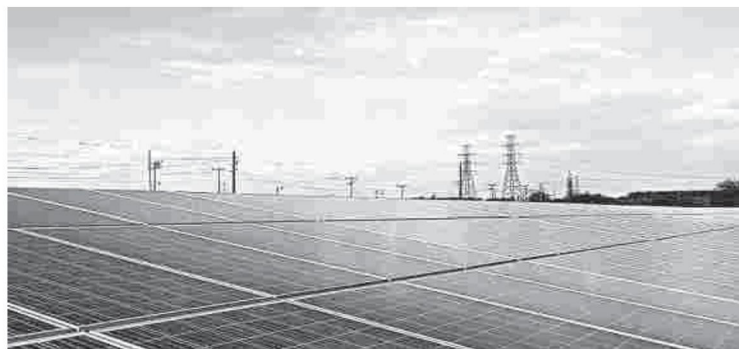
Energía fotovoltaica y la renovable, una de las apuestas de Celsia.

Caoba Inversiones agrupa activos de transmisión de energía de