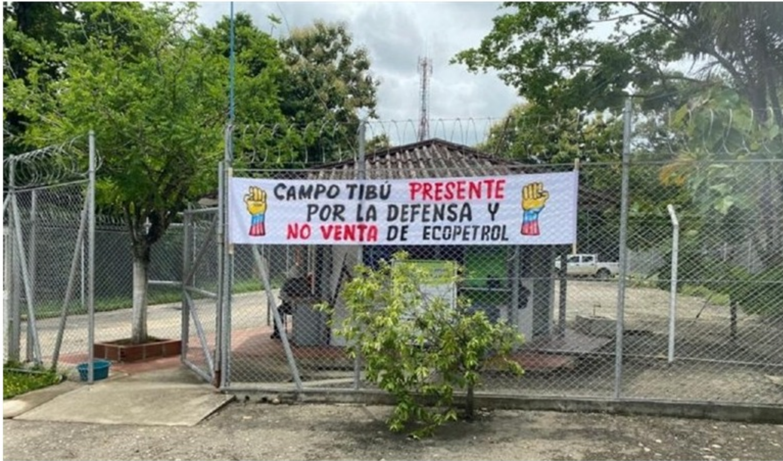
La USO advierte plan de retiros voluntarios de trabajadores de Ecopetrol .

Desde hace un mes se registra parálisis de actividades en Campo Tibú.