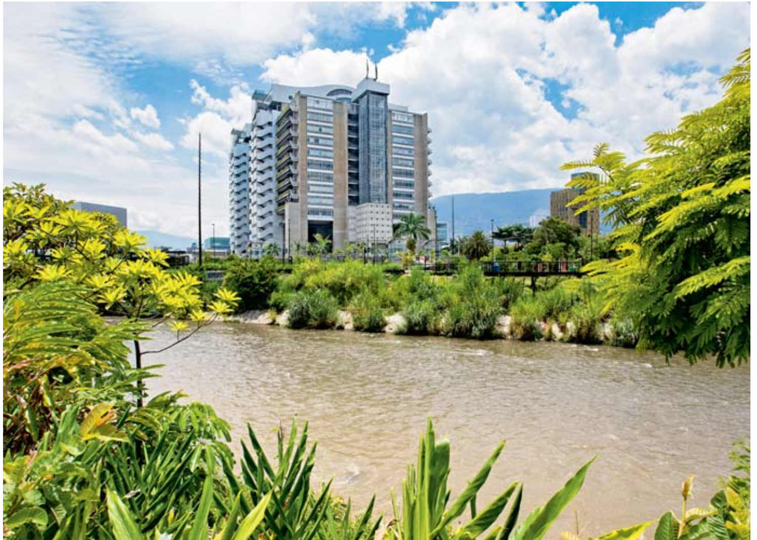
El Grupo EPM prestó servicios públicos domiciliarios el año pasado a 10,4 millones de clientes en seis países.