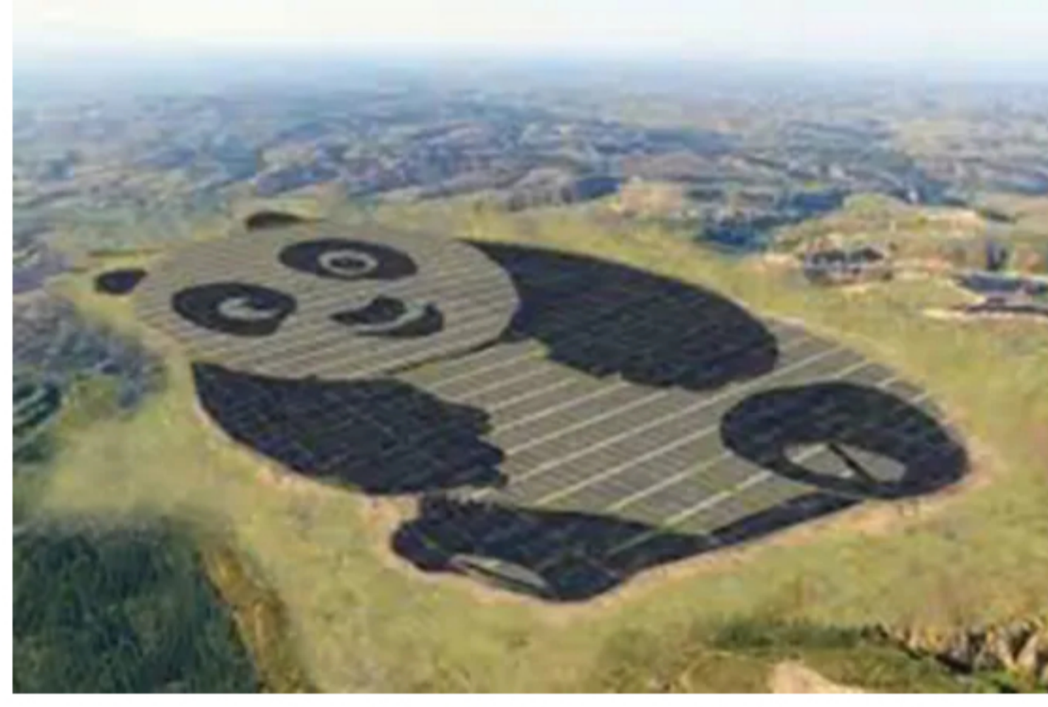
Megaparque solar en China. Colombia avanza en la transición energética.

Con San Fernando, la capacidad instalada de energía fotovoltaica para el Grupo será de 80 megavatios (MWp) en menos de dos años, luego de la inauguración del Parque Solar Castilla de 21 MWp en octubre de 2019.