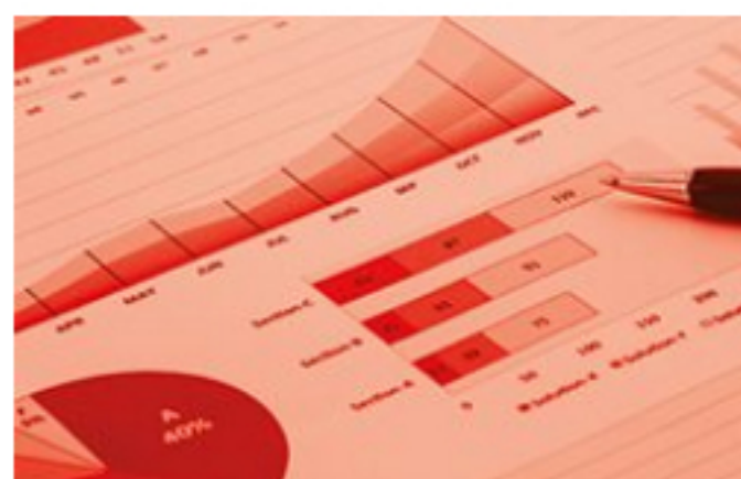
Publicidad / Media Information