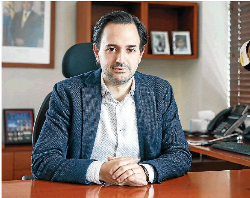
Ministerio de Minas y Energía

El ministro de Minas y Energía, Diego Mesa, dijo que espera que durante este Gobierno en el país se puedan hacer proyectos piloto de fracking y recibir más inversión en áreas Offshore.