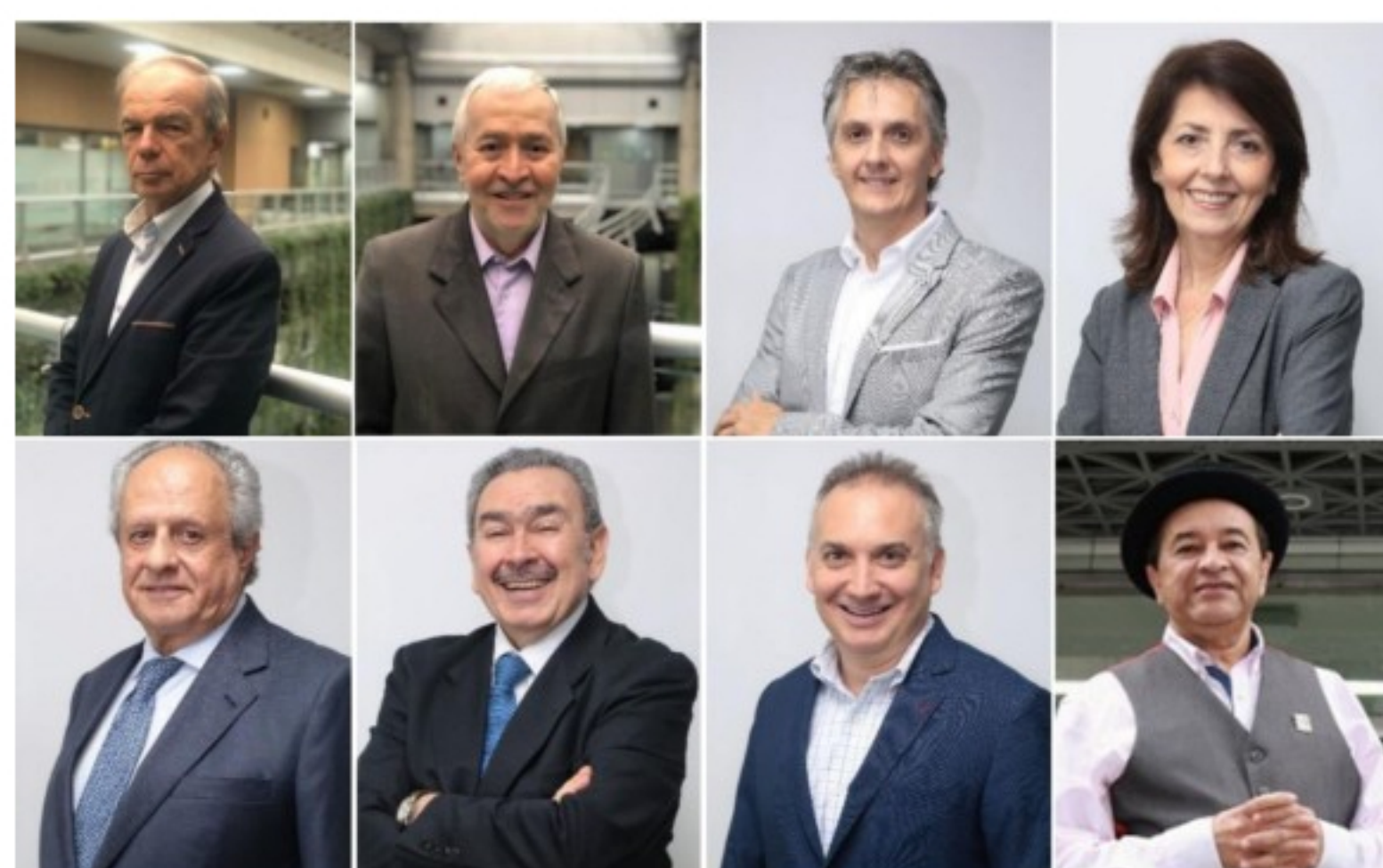
Junta Directiva de EPM

Contagio Radio agosto 13, 2020 at 6:26 pm