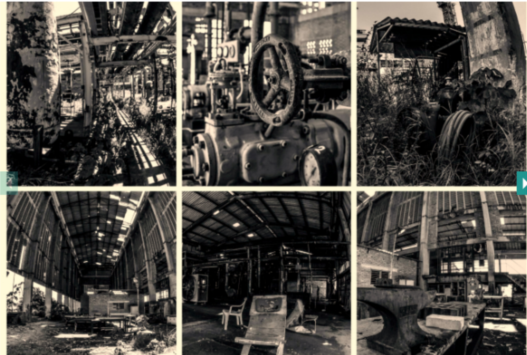
“Ferticol”, proyecto fotográfico de Jaime Arnache.

El reconocido fotógrafo barramejo Jaime Arnache presenta sus fotografías sobre “Ferticol”, el edificio sobre el que ya la Gobernación de Santander ordenó su liquidación y que significa un antes y un después en la cultura local.