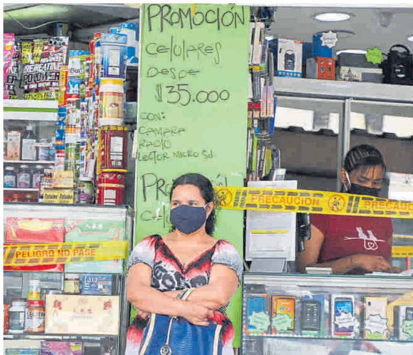
El 47% de las empresas autorizadas para operar pertenece al sector comercio.