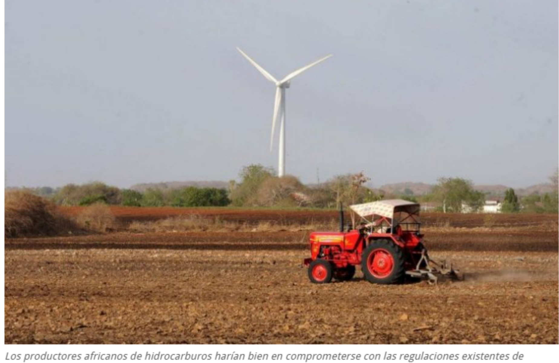
Los productores africanos de hidrocarburos harían bien en comprometerse con las regulaciones existentes de ventilación y quema, porque se avientan políticas específicas para el metano.