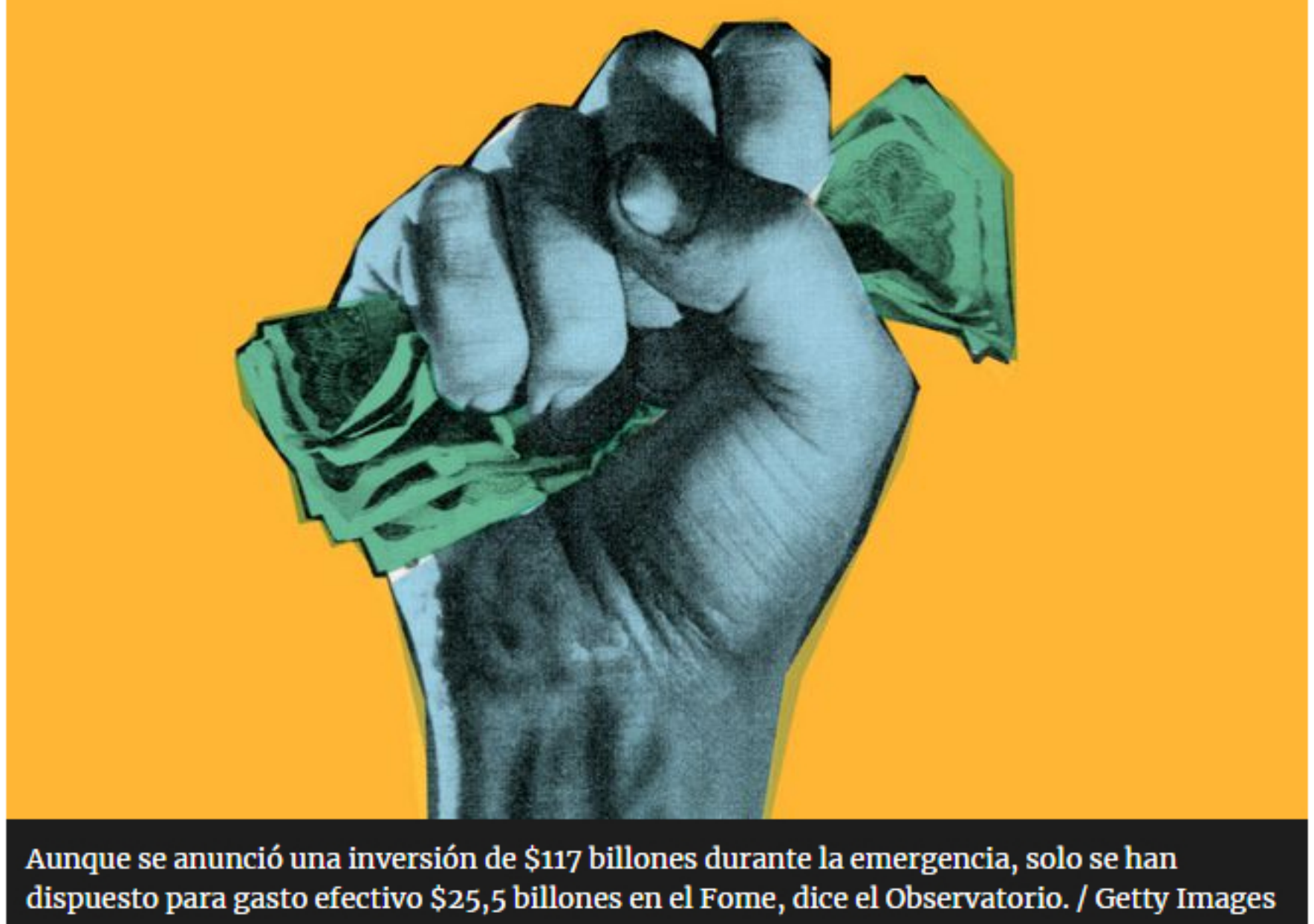
Aunque se anunció una inversión de $117 billones durante la emergencia, solo se han dispuesto para gasto efectivo $25,5 billones en el Fome, dice el Observatorio.

Afirmar que la pandemia redefinió las prioridades en materia de política pública es, a estas alturas, una obviedad. Sin embargo, una emergencia de la que muchos prometieron “salir mejores” y “reinventarse” parece servir de excusa para perpetuar malas prácticas en materia de transparencia y ejercicio fiscal responsable. El presupuesto general de la nación para 2021 parece ser, lastimosamente, prueba de ello.