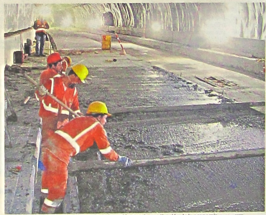
Las obras públicas lideran la estrategia de inversión para la reactivación de la economía.

CONFIRMAN FECHAS PARA EL METRO En la última semana de octubre se firmará el acta de inicio del megaproyecto, cuyas intervenciones irán hasta 2027. Operaría desde 2028. Pág. 7