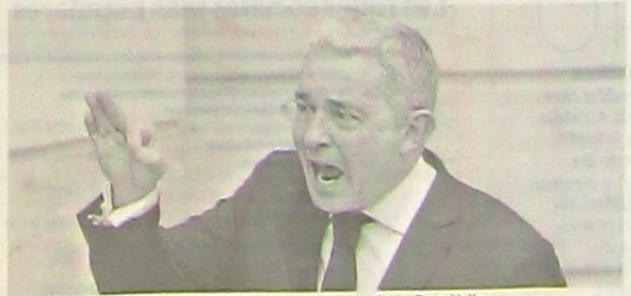
Álvaro Uribe Vélez, senador y expresidente de la República.

La detención domiciliar dictada por la Corte Suprema generó duras reacciones. Iván Duque pide que se pueda "defender en libertad". Pág. 8