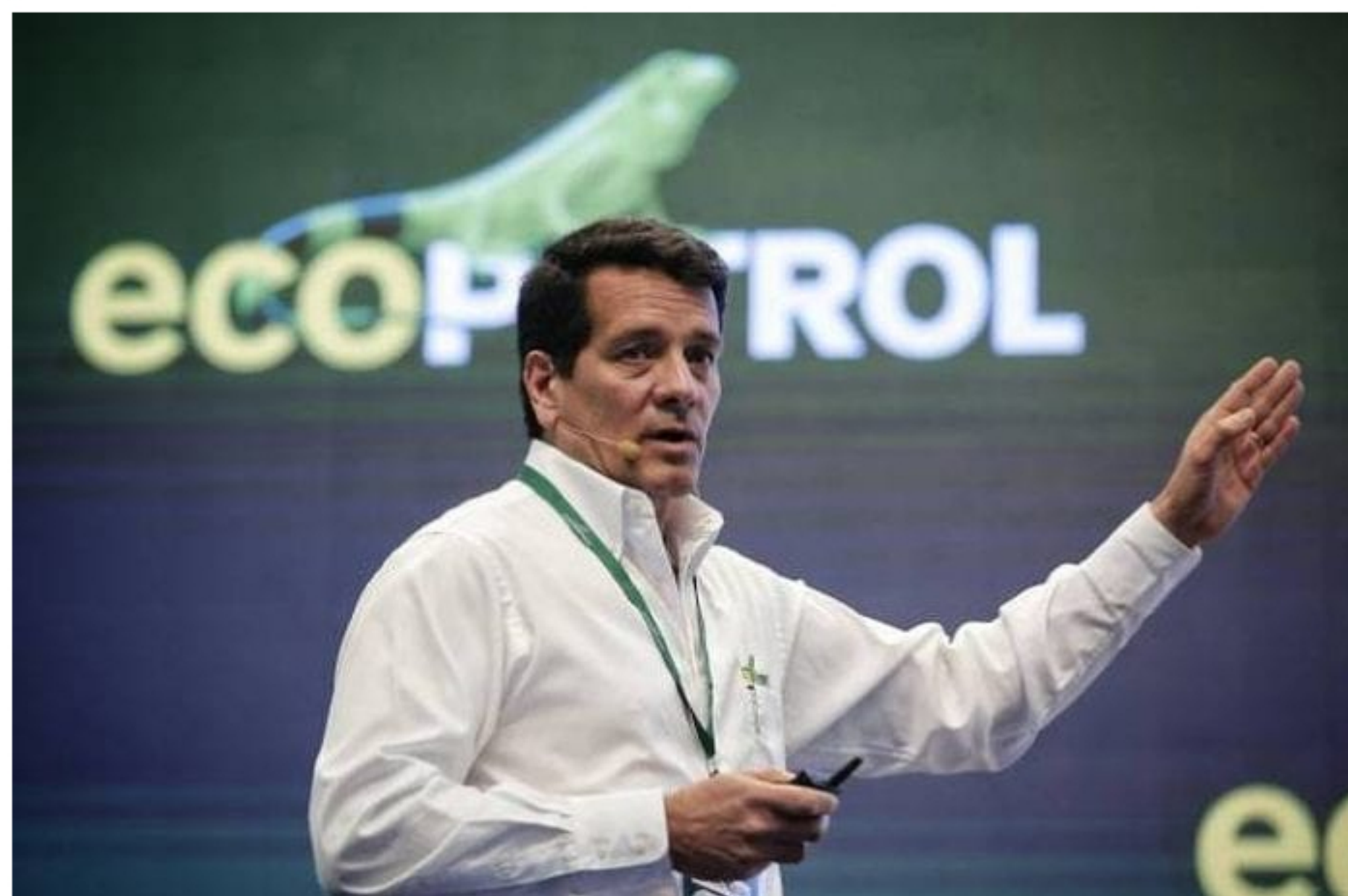
Felipe Bayón, presidente de Ecopetrol

Además de informar sus resultados financieros para el segundo trimestre y primer semestre consolidado del año, Ecopetrol actualizó su plan de negocios 2020-2022, el cual tendrá una inversión orgánica estimada entre US$11.000 millones y US$13.000 millones, y que pretende responder a la crisis por Covid-19 y bajos precios del crudo y proteger la sostenibilidad del negocio de la compañía.