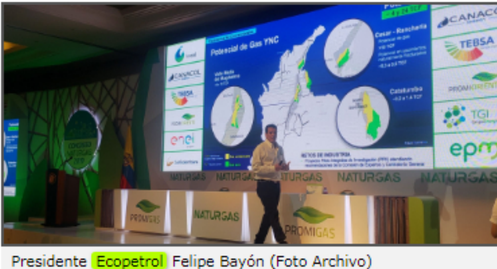
Presidente Ecopetrol Felipe Bayón

El nuevo plan de negocios de la compañía contempla inversiones orgánicas entre US$11.000 millones y US$13.000 millones para los próximos tres años.