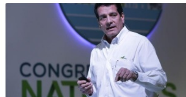
El beneficio neto de la colombiana Ecopetrol cayó 97,5% en un semestre crítico