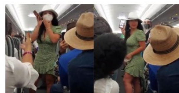
Lady COVID, el lamentable video de un escándalo en un avión que da pena ajena por todos los que ahí salen