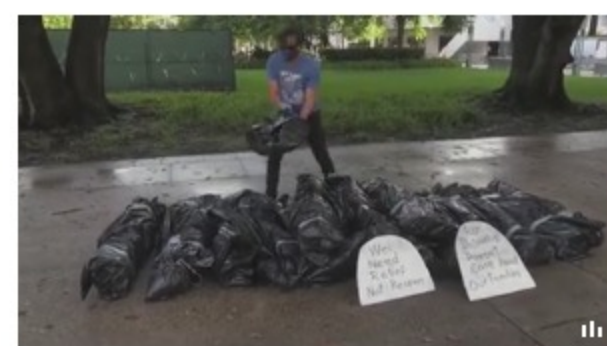
Florida le pisa los talones a California en medio de la preocupación en EE.UU.