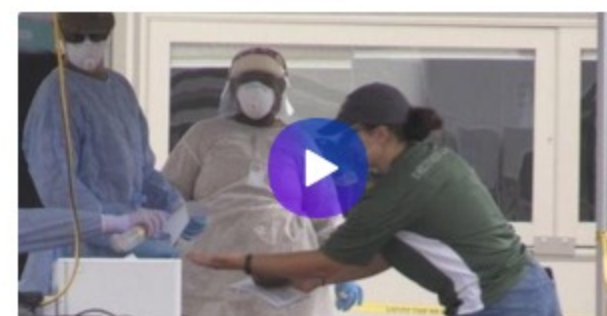
Florida le pisa los talones a California en medio de la preocupación en EE.UU.