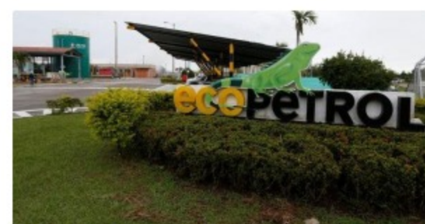
Colombiana Ecopetrol reportaría pérdidas en el segundo trimestre: analistas